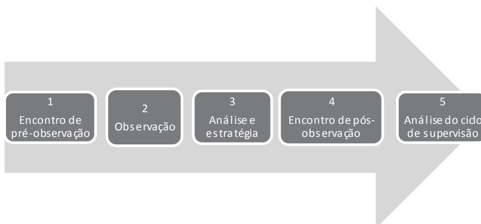
Fig. 1. Esquema do modelo de supervisão clínica

Mais tarde, Stones (1984) apoia o seu modelo de supervisão nos seus conhecimentos de psicologia do desenvolvimento e da aprendizagem, que servirão de suporte para o supervisionado na sua tarefa de ensinar. Neste modelo de supervisão, encontramos um ciclo de três etapas (Figura 2):