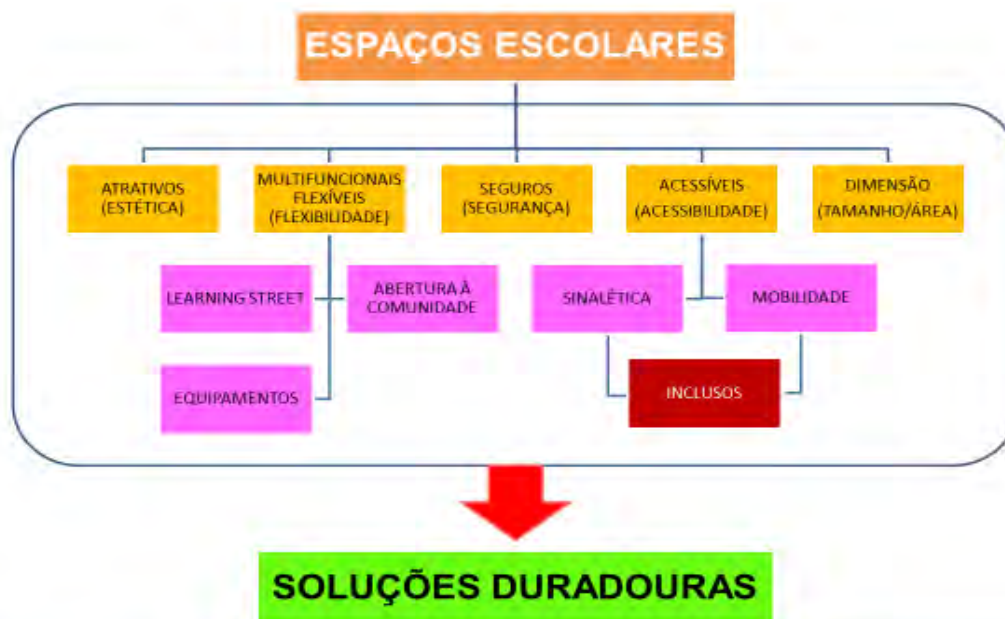
Figura 3: Características dos espaços escolares