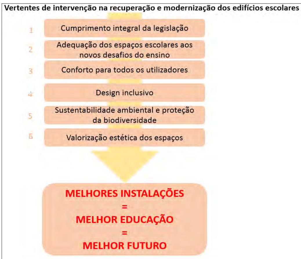
Figura 2: Modelo de intervenção no PMEES