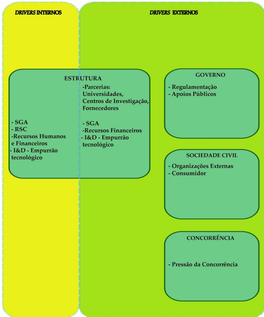
Figura 5: matriz para a inovação sustentável

considerou que o determinante “I&D – empurrão tecnológico” possui características internas e externas pois as tecnologias podem ser desenvolvidas e adquiridas fora da empresa. Parece-nos que os restantes fatores, e respetivos determinantes, não oferecem qualquer dúvida, quanto à sua natureza interna ou externa, pelo que não serão aqui abordados.