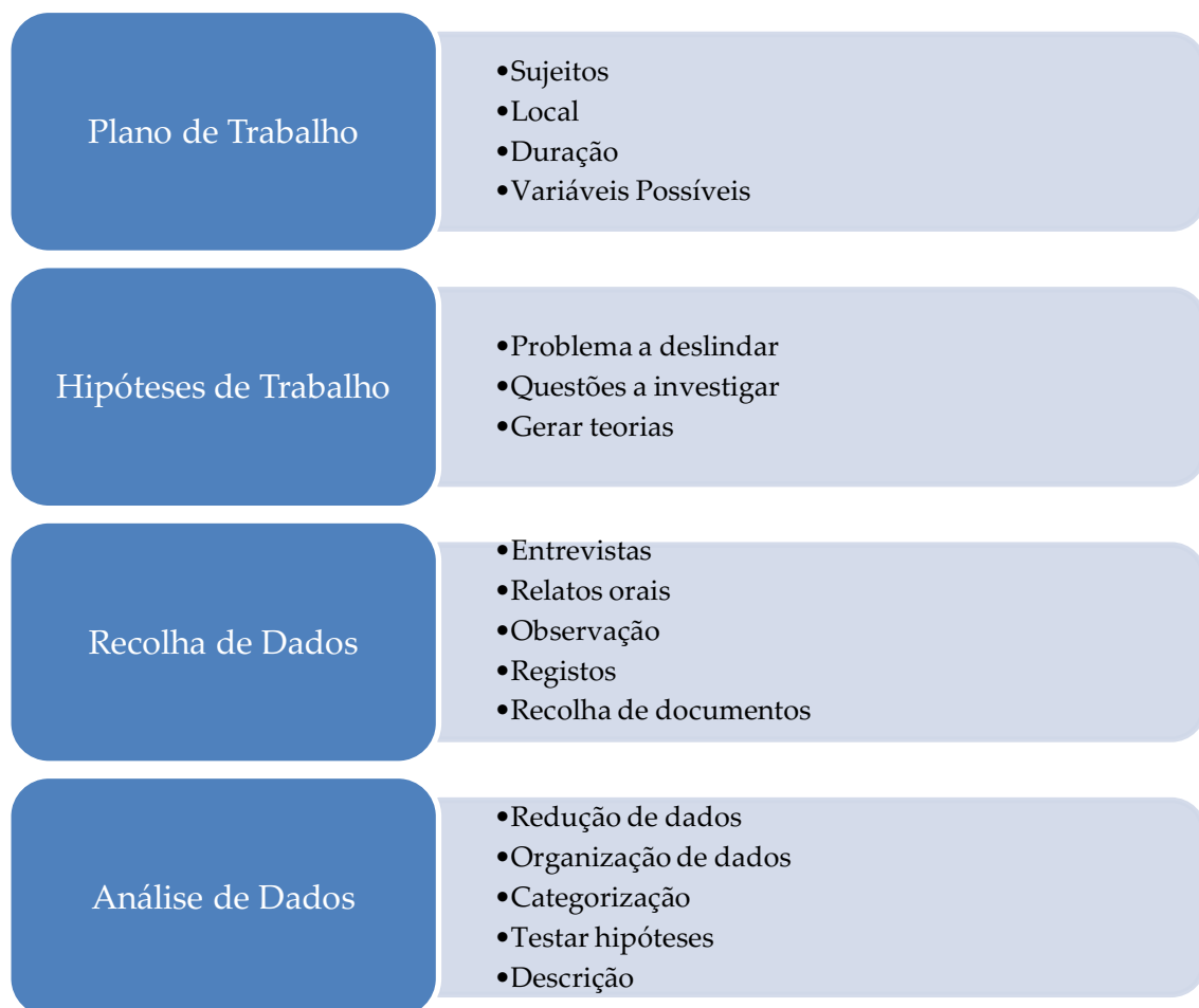
Figura 4: desenvolvimento de um plano qualitativo (adaptado de Wiersma, 1995, p. 218 e Clara Coutinho, 2011, p. 191)

No que respeita à análise de dados Clara Coutinho (2011, p. 191) apresenta um esquema de desenvolvimento de um plano qualitativo, adaptado de Wiersma, (1995, p. 218), referindo que “o carácter indutivo da pesquisa empírica em planos de investigação qualitativa, leva a que as diferentes fases de desenvolvimento do projeto de investigação se constituam como elementos de um contínuo que liga o problema aos dados” (ver figura 3):