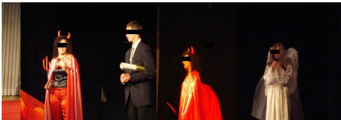
Ilustração 5 - Vicente, Gil. O Auto da Barca do Inferno (atualização), Auditório do IPJ, Braga, 2008