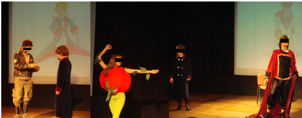
Ilustração 6 - Exupéry, Saint. O Príncipezinho, Auditório do IPJ, 2007