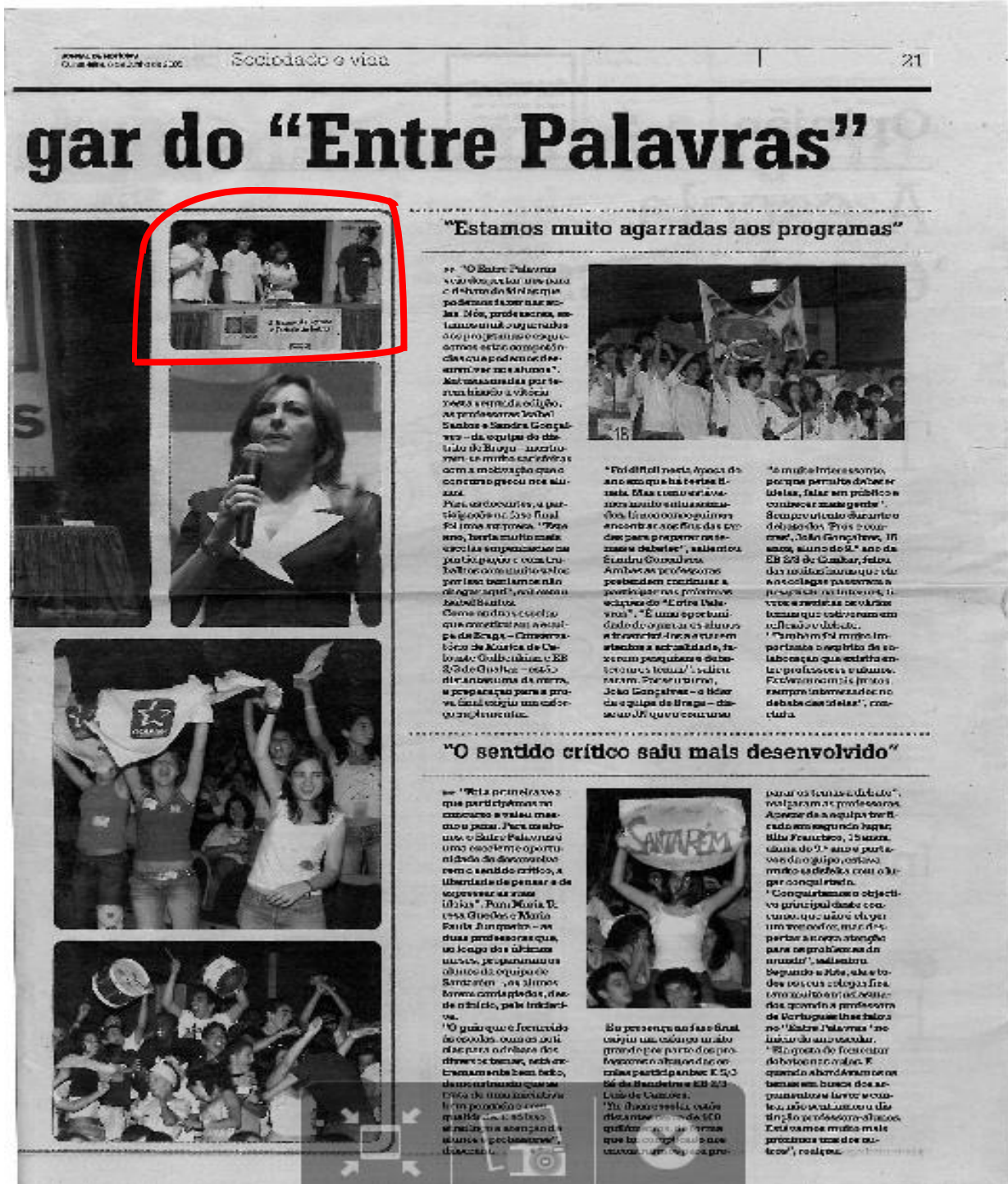
Ilustração 10 - Entre Palavras, segunda vitória a nível nacional, Vila da Feira, 2006