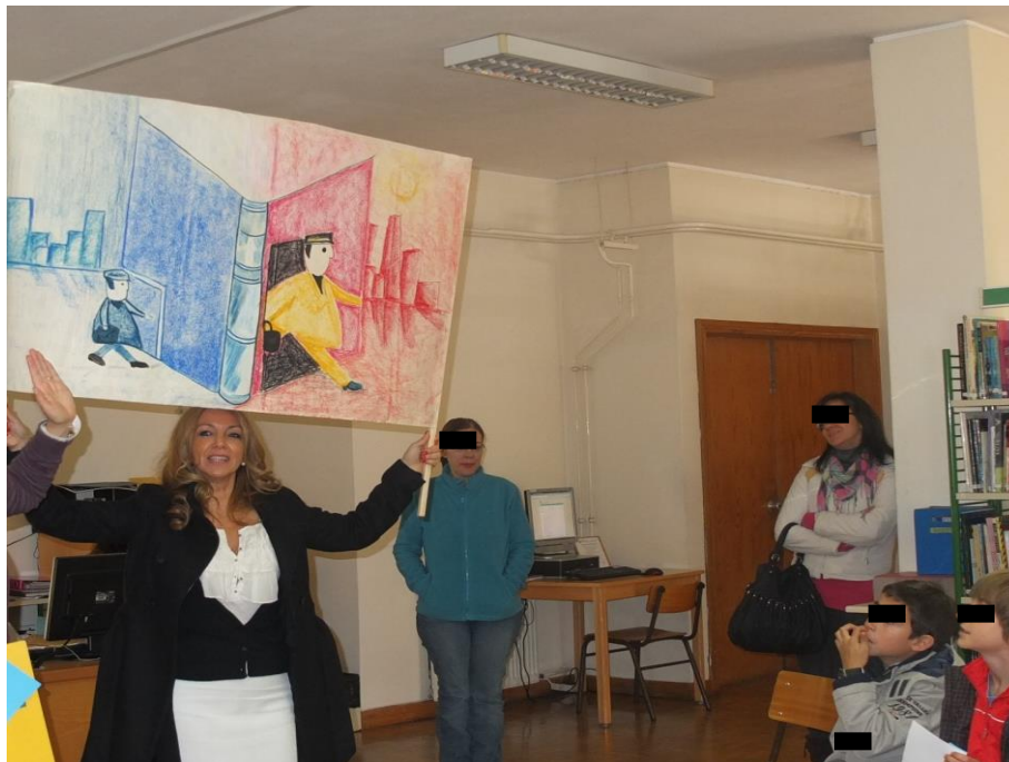
Ilustração 11 - Projeto Integrar, alunos do 1º Ciclo, Biblioteca de Gualtar 2012