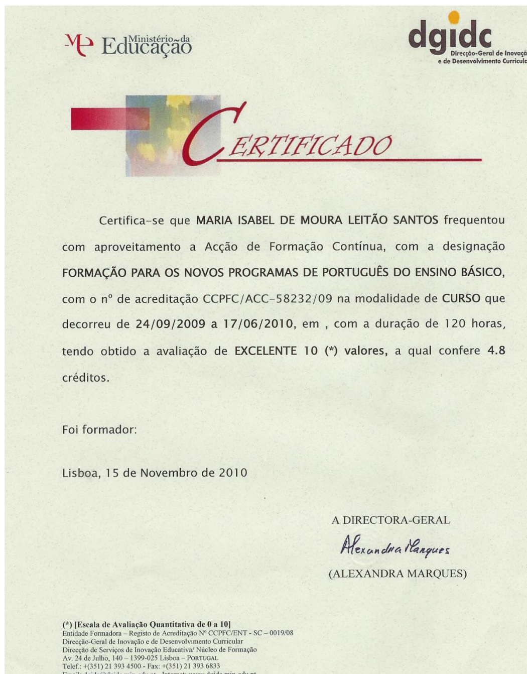
Ilustração 13 - Certificado de Formação para Formação de Professores