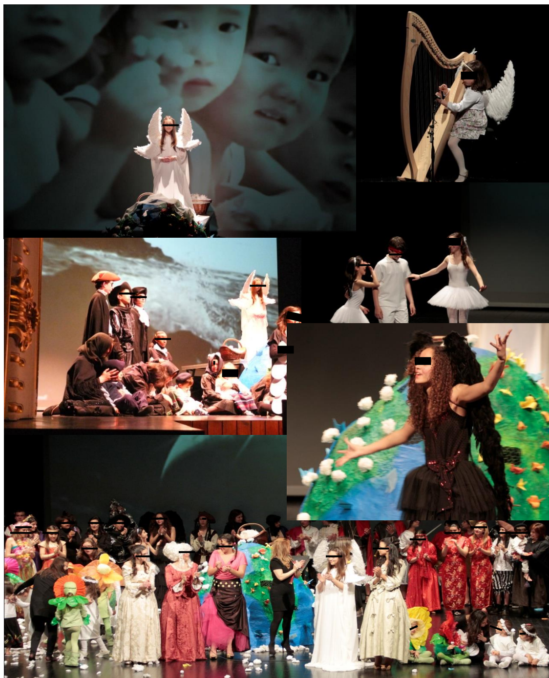
Ilustração 8 - Alegoria da Criação do Mundo, Theatro Circo, Braga, 2011