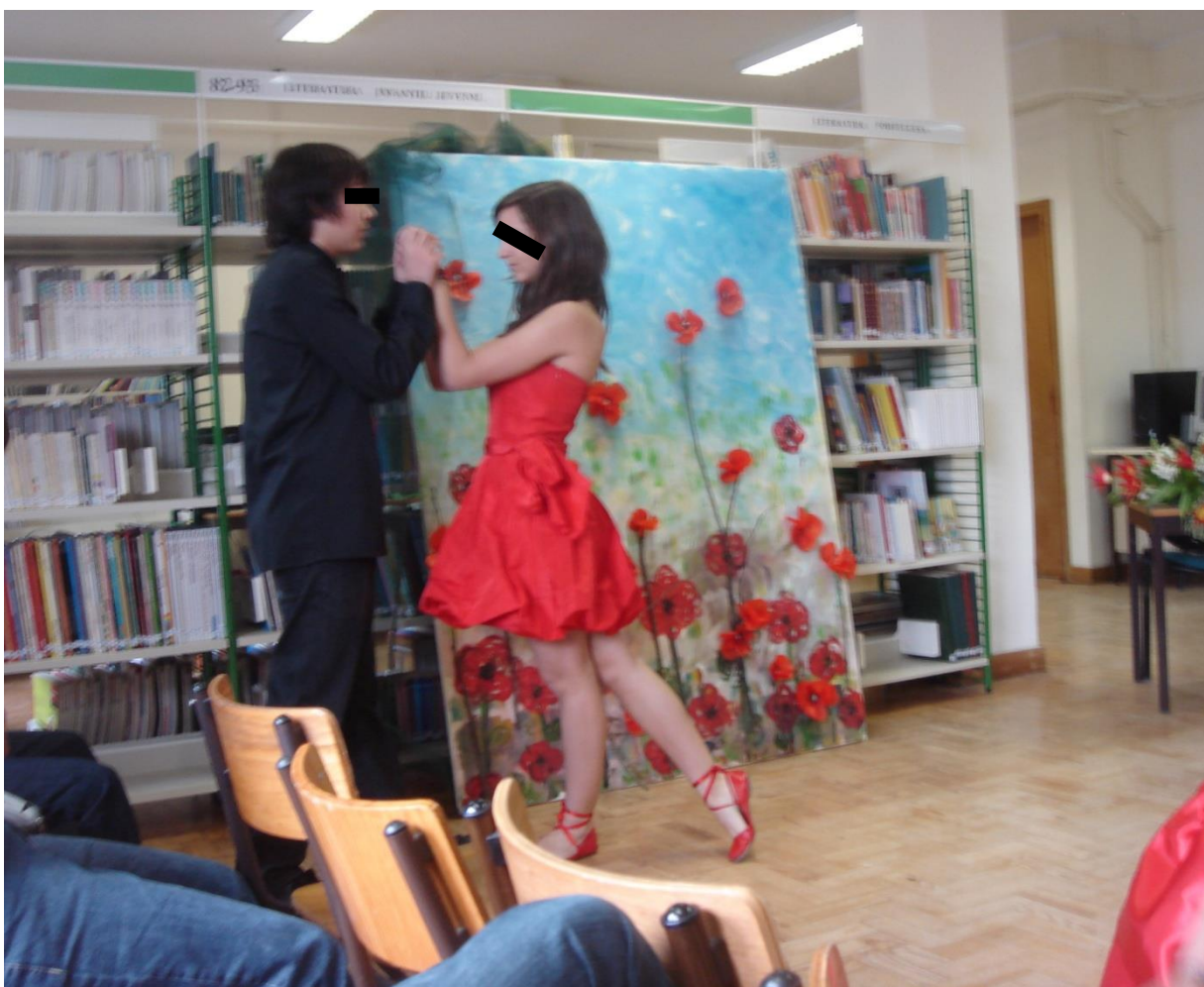
Ilustração 9 - Festival de Poesia, Biblioteca da Escola de Gualtar