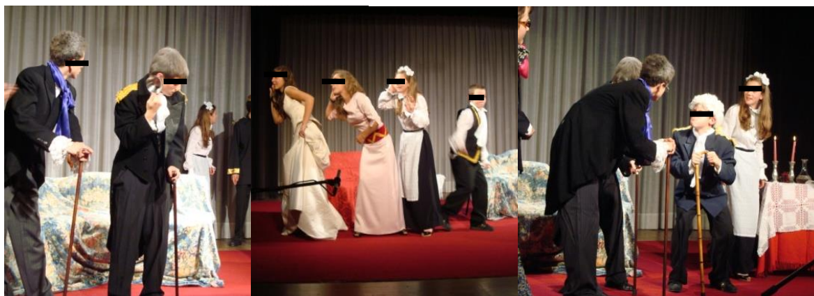
Ilustração 4- Garrett, Falar Verdade a Mentir , Teatro Circo, junho, 2009