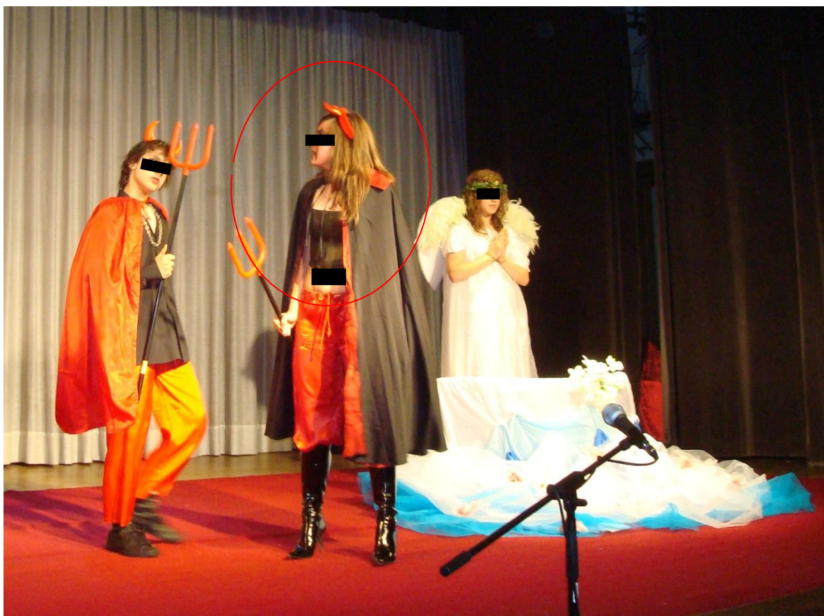
Ilustração 3- Aluna acompanhada pelos Serviços de Psicologia e Orientação da Escola de Gualtar (não verbalizava oralmente na sala de aula, apenas o fazia por escrito)