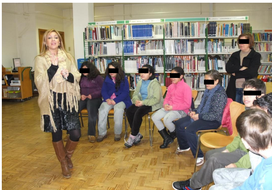
Ilustração 12 - Projeto Integrar, alunos do 1º Ciclo, Biblioteca de Gualtar 2012