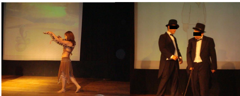
Ilustração 7 - Exupéry, Saint. O Príncipezinho, Auditório do IPJ, 2007