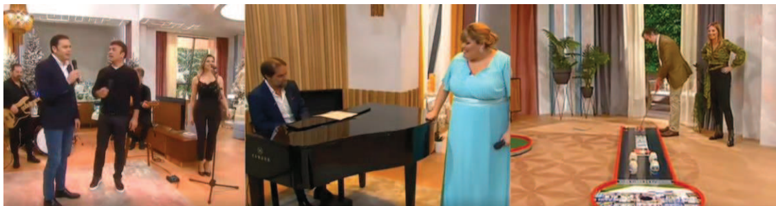
Figura 7 - Exemplos de Hobbys/Talentos Desconhecidos

Em quinto e último lugar, apesar de as entrevistas tratarem a dimensão humana, houve atores políticos que utilizaram o momento no programa para revelar ambições que têm para o futuro. Por exemplo, ambição de chegar à liderança governativa, à liderança de partidos ou através do anúncio, em direto, de recandidaturas a cargos políticos. Tendo em conta a génese do Programa da Cristina , podemos olhar para esta subcategoria como uma estratégia dos atores políticos para trazerem para a agenda mediática temas que, no âmbito de entrevistas jornalísticas, não seriam recebidas com o mesmo impacto entusiasta e obrigariam os atores políticos a responder ao escrutínio das perguntas dos jornalistas.