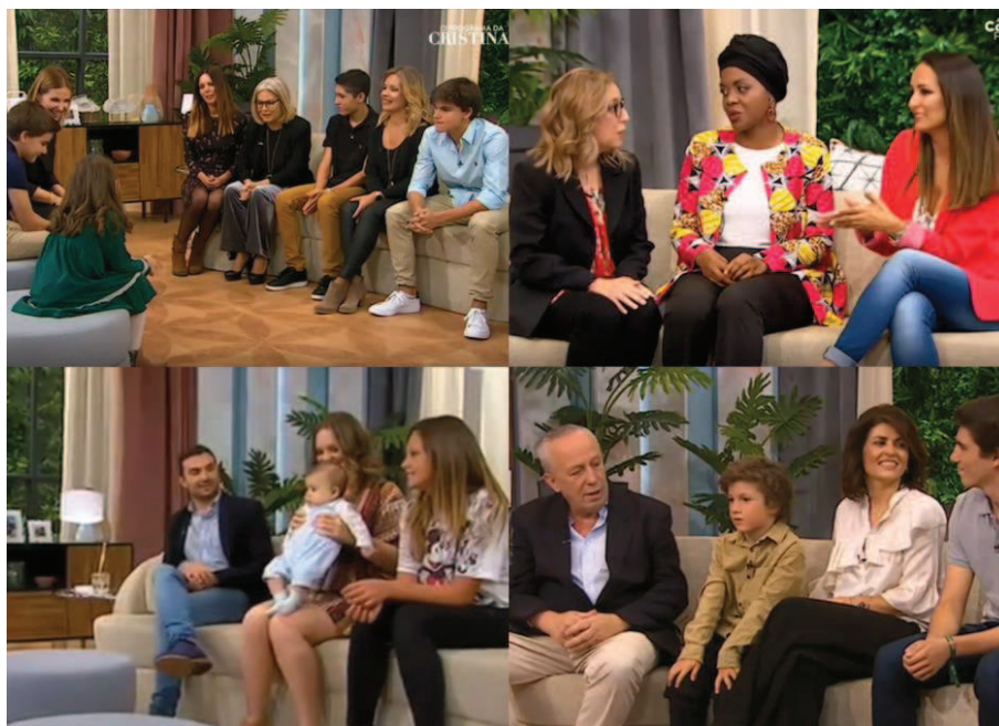
Figura 6 - Presença de Familiares/Amigos no Programa

Em segundo lugar, ao longo das entrevistas foram abordados temas relacionados com assuntos políticos. Contudo, esta subcategoria revelou tratar-se de uma exploração do percurso político e não propriamente no escrutínio das ações levadas a cabo politicamente pelos atores.