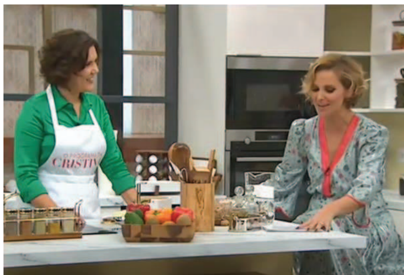
Figura 8 - Assunção Cristas Cozinha Arroz de Atum no Programa

Apesar de não ter havido cumprimento físico entre Assunção Cristas e Cristina Ferreira (tanto no início, como no fim da entrevista), ficou evidente a negociação de proximidade entre a política e a apresentadora, na qual ambas deram a entender aos telespetadores de que a conversa iria acontecer num registo informal, onde prevalecia o apreço de Cristina Ferreira por Assunção Cristas.