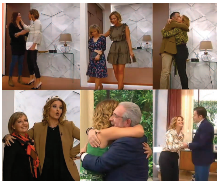
Figura 3 - Exemplos de Cumprimento Físico no Programa

Todos os intervenientes que marcaram presença no programa durante a pandemia, ao longo do ano de 2020, não cumprimentaram fisicamente a apresentadora. Contudo, uma vez que o país ultrapassava uma pandemia e o cumprimento das regras sanitárias era imperioso, não foram avaliadas e contabilizadas para o presente estudo.