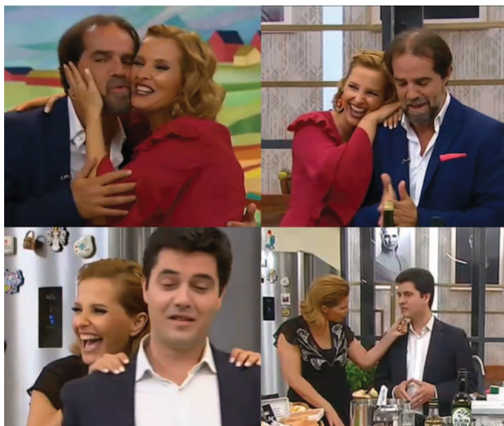
Figura 5 - Exemplos de Toque entre os Atores e a Apresentadora

Para reforçar a demonstração da proximidade revelada entre os atores políticos e a apresentadora, também o cumprimento físico e o forma como estavam próximos ao longo da conversa, são reveladores do apelo à dimensão da humanização do ator político (Figura 5).