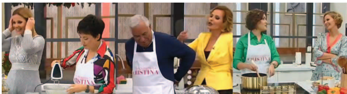
Figura 4 - Utilização de Avental no Programa

No momento em que a apresentadora oferece o avental para os convidados utilizarem, os atores políticos agem com surpresa. Logo de seguida, vestem-no para dar início à confeção do prato. Dessa forma, o ato de vestir o avental em direto pode servir para humanizar a presença do ator, ou seja, para demonstrar descontração e, paralelamente, permitir que os atores retirem a “capa” de políticos.