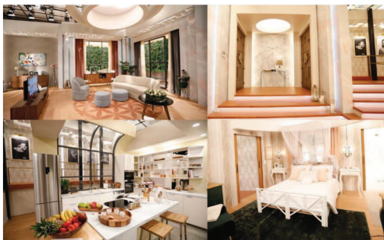
Figura 1 - Cenário do Programa da Cristina 4

Segundo o artigo “ Big Show Cristina Ferreira ”, o programa foi ao encontro da linha dos talk shows produzidos nos Estados Unidos da América, no final do século XX: