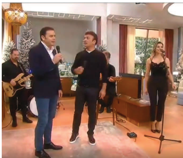
Figura 12 - Luís Montenegro Canta com Tony Carreira

Contudo, podemos verificar que a performance poderá ter sido negociada antes da emissão começar pelas seguintes razões: em primeiro lugar, Cristina Ferreira retira, de repente, dois microfones da bancada da cozinha – um para Luís Montenegro, outro para Tony Carreira -, como se o momento já estivesse, a priori , pensado e preparado para acontecer; em segundo lugar, o cenário, o coro e os músicos já estavam posicionados na sala para o momento musical; em terceiro e último lugar, a escolha da canção “Sonhos de Menino” poderá ter sido escolhida propositadamente para o momento, uma vez que, segundo as palavras Luís Montenegro, a letra da canção apresenta “uma bela história, que lhe dá muito brilho. Demonstra a capacidade de ir atrás de um sonho e de ultrapassar as dificuldades e os obstáculos que a vida nos coloca”. Nesse sentido, a encenação do momento musical demonstrou o lado descontraído do ator político, mas, simultaneamente, a explicação do significado da letra da música refletiu a vontade de lutar pelos seus objetivos no momento de disputa pela liderança no partido.