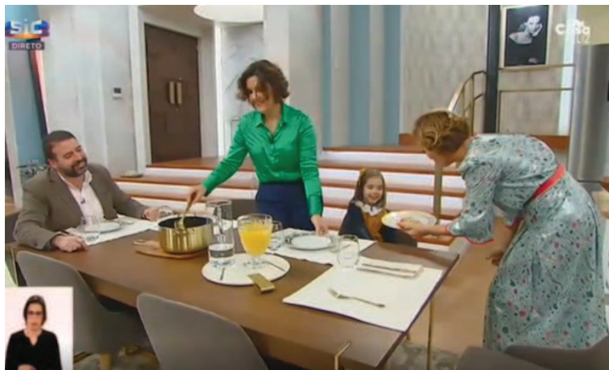
Figura 9 - Assunção Cristas Serve Arroz de Atum à Família

A encenação da normalidade, para além de estar presente através da simulação de um almoço às dez da manhã, é sublinhada pela figura do marido, quando questionado sobre a forma como olha para o papel de Assunção Cristas enquanto mulher com um cargo político de poder.