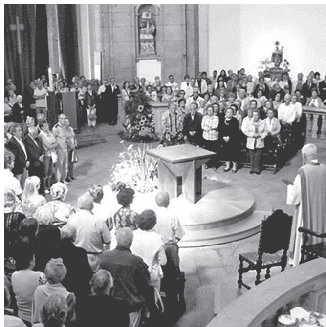
Comunidade cristã da Serra do Pilar, Vila Nova de Gaia.