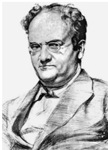
Retrato de Romolo Murri

A sua atitude, muitas vezes polémica, em relação à instituição eclesiástica e o seu trabalho no Parlamento, intencionado, de certa maneira, a obrigar a Igreja a fazer as reformas que ele não conseguira realizar quando