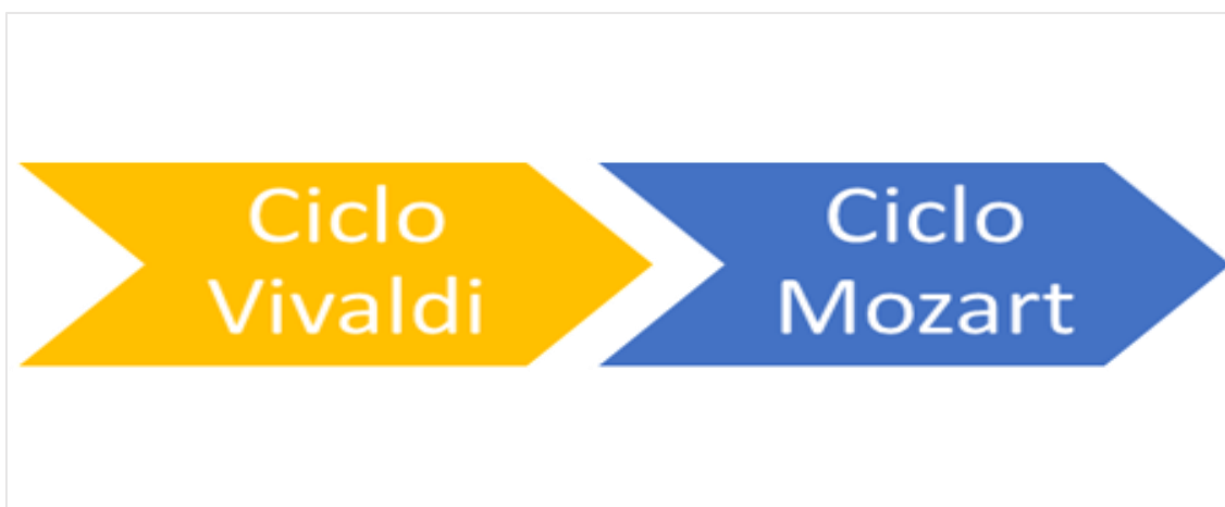
Figura 1: Sequência progressiva dos ciclos do Cursos de Iniciação Musical