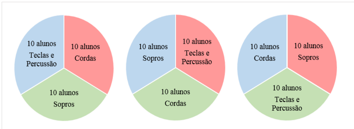
Figura 3: Exemplo de trajeto para um aluno durante o ciclo Vivaldi

percussão, canto (10 alunos). Estes três grupos de alunos (10) circularão no período seguinte, para uma nova família de instrumentos, tal como elucidada a Figura 3.