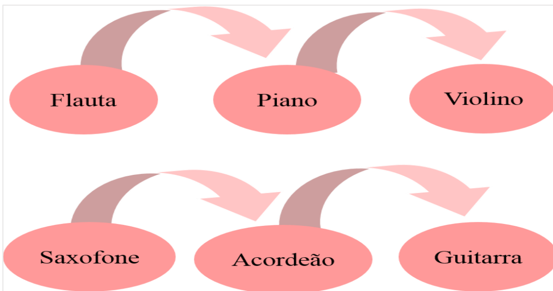
Figura 4: Exemplo de trajeto a realizar durante dois anos letivos no ciclo Vivaldi

Consequentemente, na Figura 4 apresentamos um exemplo de um percurso a realizar pelo aluno na prática instrumental no Ciclo Vivaldi.