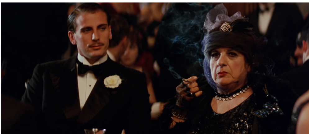
Figura 3. Personagens do filme La Leggenda del Pianista Sull'oceano de Giuseppe Tornatore (1998).

E segue para mais três improvisações musicais muito distintas, com as quais Mil e Novecentos passa a caracterizar as próximas personagens, dizendo “Vês aquele ali? Ele não consegue esquecer nada. A sua cabeça está a explodir de memórias e não há nada que ele possa fazer. Ouve a sua música.”