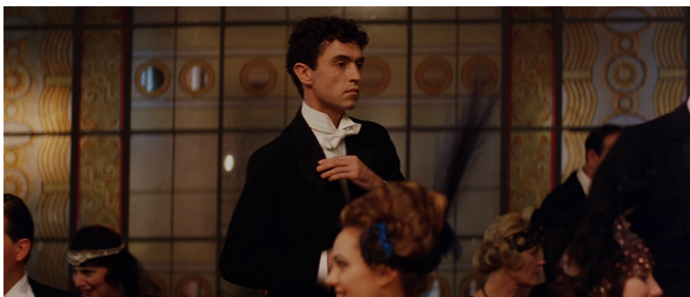
Figura 6. Personagem do filme La Leggenda del Pianista Sull'oceano de Giuseppe Tornatore (1998).

O pianista toca agora uma melodia consonante com uma quarta pessoa: “Agora repara neste. Vês como ele anda? Eu diria que está com o fato de outra pessoa, pelo modo como o veste. Eu diria que é um passageiro clandestino que se infiltrou na primeira classe à procura de uma pequena aventura amorosa. Tem a América estampada nos olhos. Ele será o primeiro a vê-la. Já consigo ouvi-lo a gritar: (...) América!”