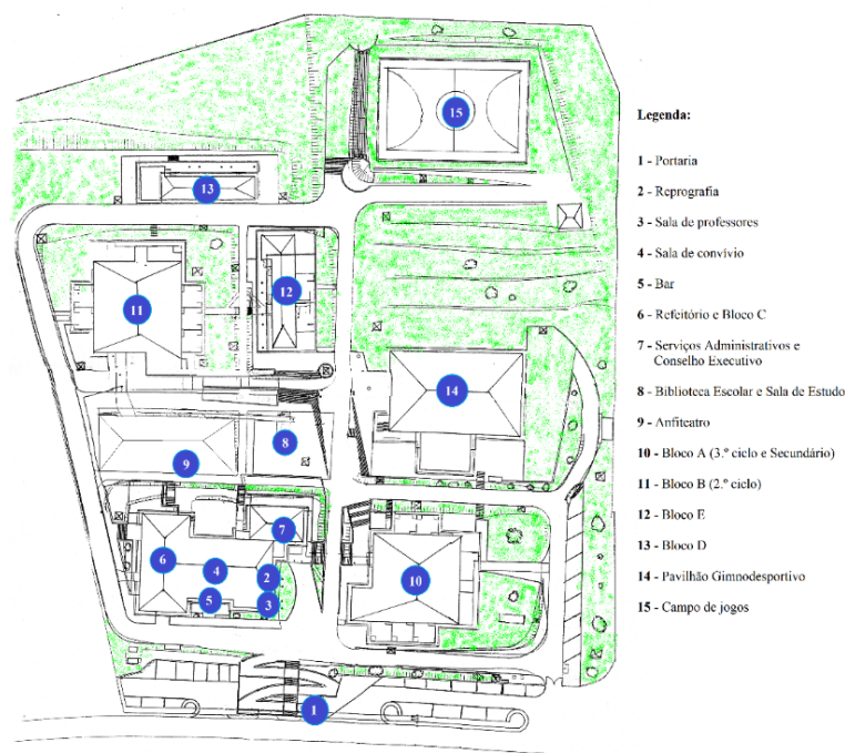
Figura 2 – Planta da Escola Sede

As turmas da EBSN são de dimensão reduzida, principalmente as turmas mais afastadas da escola sede. As turmas do 2.º e 3.º ciclos, por norma, são compostas por quinze a vinte alunos em função do número de alunos com Necessidades Educativas Especiais (NEE), o que exige uma diminuição de alunos por turma. No ensino secundário, e fruto da escolaridade obrigatória, tem-se assistido a um maior número de alunos matriculados, embora alguns dos alunos que terminam o 3.º ciclo optem por prosseguir os estudos em cursos profissionais.