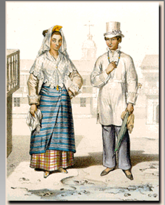
mestizos de sangley, c. 1846