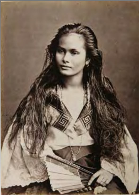
mestiza de sangley, c. 1875