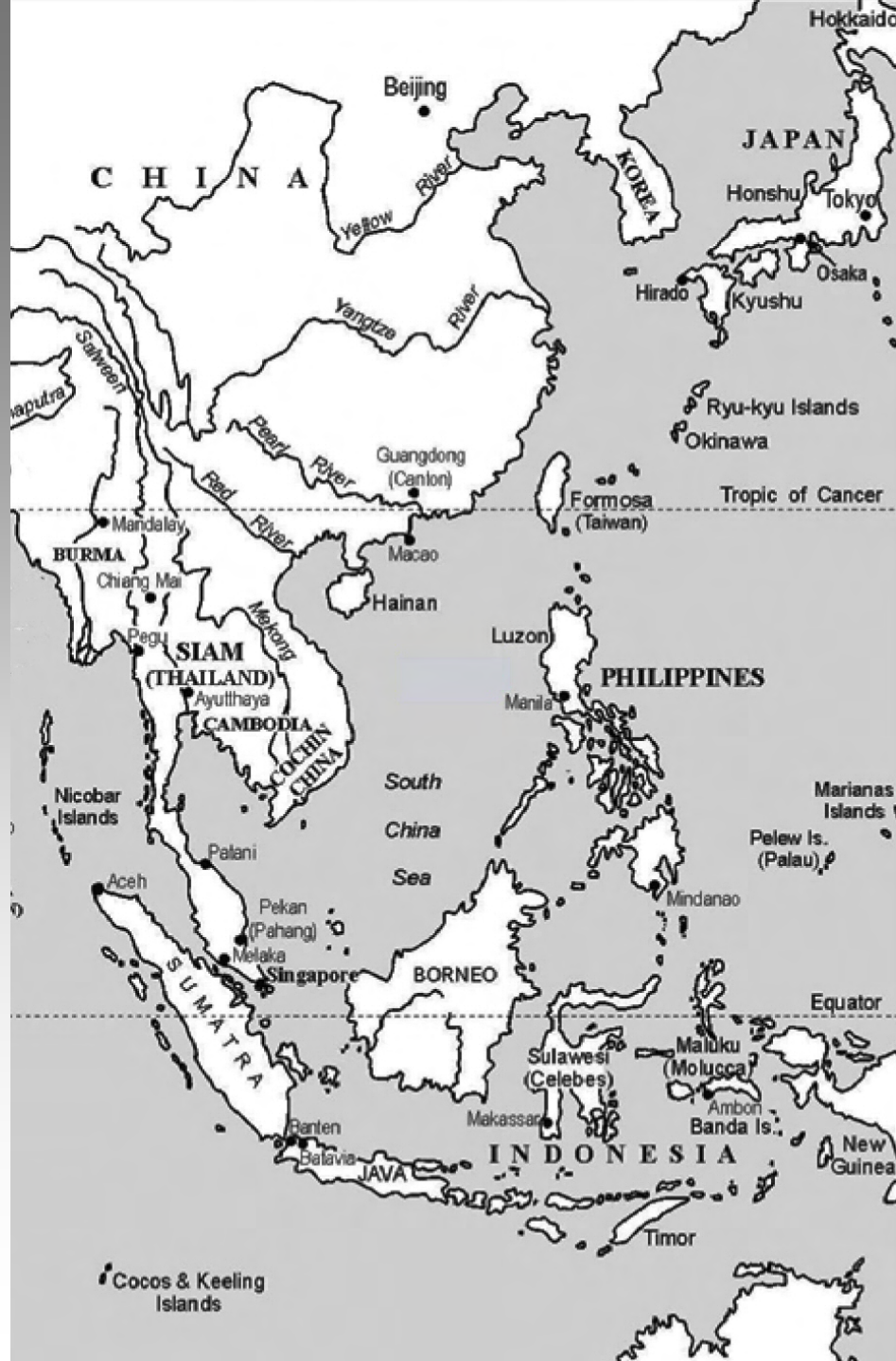
Peter Borschberg, "The Johor-VOC Alliance and the Twelve Years' Truce" International Law and Justice Working Papers , 2009