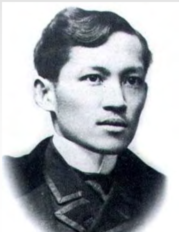
José Rizal (1861-1896)