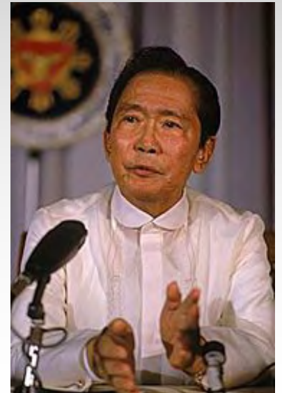
Ferdinand Marcos Presidente das Filipinas 1965-1986