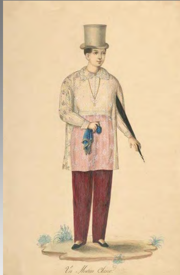
Un Mestizo Chino, séc. XIX