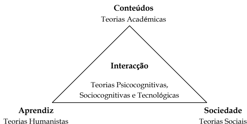
Fig. 4 - Os pólos das teorias contemporâneas da educação (Costa, Pereira, D., 2007)

Conforme a ênfase dada a cada um dos pólos, assim teremos diferentes teorias e, consequentemente, diferentes práticas pedagógicas.