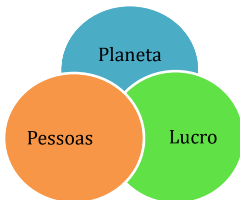
Figura 1. Triple Bottom Line. Fonte: Elkington (1998)

O conceito de turismo sustentável, por sua vez, segue a mesma linha de pensamento, sendo definido como um desenvolvimento turístico que responde às necessidades do presente ao mesmo tempo que protege e potencializa as oportunidades de gerações futuras (Lee, 2013; Nicholas et al., 2009). O desenvolvimento do turismo deve, portanto, ser feito de acordo com os princípios da sustentabilidade e tendo por base os seus três pilares fundamentais para que as necessidades e exigências da comunidade local sejam sempre tidas em consideração.