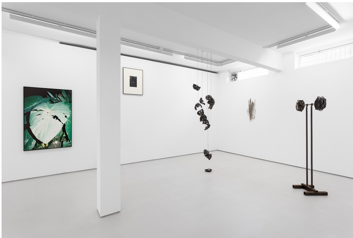
Matéria-Afecto . Vistas gerais da exposição na Galeria NO·NO.

esta matéria, pois não se trata simplesmente de inventar uma linguagem para o afecto, isso seria trazer este último ao nível da representação. De certa forma, não há solução para esta situação a não ser reconhecê-la como um problema – e tentar ir além dela, que é o que se pretende com a analogia do tropismo adiante.