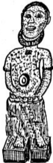
FIG. N.º 1