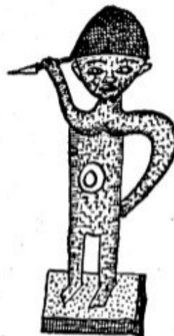
FIG. N.º 2