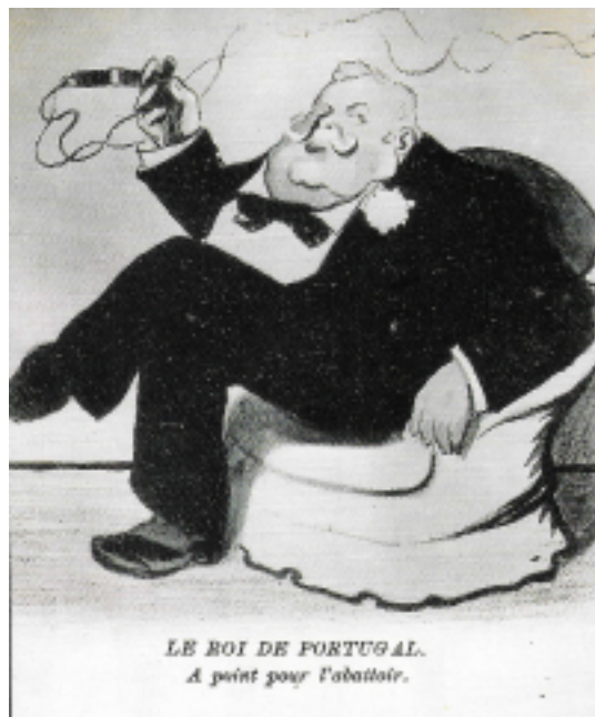
Figura 6: Assiette au Beurre (Paris), 1905

Com o passar dos anos, o tom com que a imprensa se referia a D. Carlos I foi piorando. Fora dos limites do sistema monárquico, vociferava a violenta imprensa republicana, liderada pel' O Mundo , a que se juntaria A Lucta (em 1906), retratando-o como um inútil, supérfluo, corrupto, obeso, mulherengo, devasso e adúltero, metediço ou irresponsável, vendido à Inglaterra e só valentão em casa, e conluiado sempre com a camarilha política que roubava o povo. Se isto não chegasse – e sempre que isto não chegava – era ainda insultado como caçador ausente, mau pintor, oceanógrafo diletante e esbanjador que, sob a falsa capa de grande diplomata, se passeava à custa do erário público. Como Rocha Martins sintetizaria, com algum fundo de verdade, a imprensa era um mar de “acerbismo crítico, terrível para um povo que não sabia ler nem discernir”, cheia de “ironias, girândolas furibundas, satiricismos, sarcasmos e charges