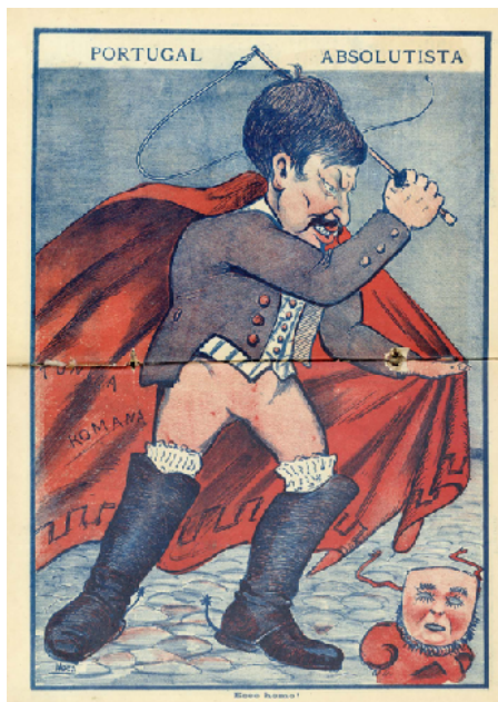
Figura 8: A Paródia , maio de 1907