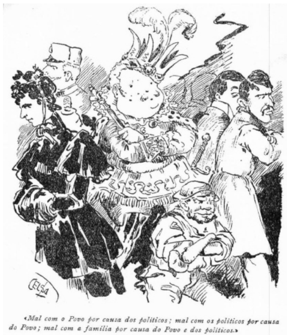
Figura 4: O Micróbio , janeiro de 1895

Em 1896, D. Carlos I era um burguês obeso e disforme, inchado à dimensão de uma bola ou de um balão rolante 37 .