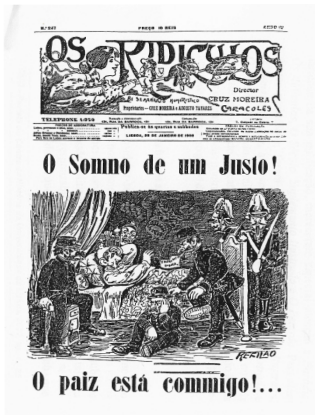
Figura 12: Os Ridículos , dezembro de 1907

Para contrabalançar esta barragem de representações sensacionalistas e moralmente demolidoras, uma ou outra peça jornalística, movida pela genuína curiosidade em relação ao rosto então dominante da política portuguesa, ou porventura agenciada como manobra de contrapropaganda lisonjeadora, compôs-lhe um retrato mais afável e distendido, de um homem simples, sereno e refletido, afetivo com a família, asceta nos hábitos e culto nas leituras 57 . Mas a maioria das notícias