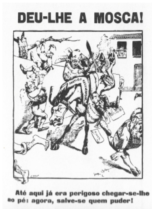
Figura 1: O Século . Suplemento Humorístico, 23.5.1901

A vingança de Hintze Ribeiro veio na forma de uma lei eleitoral, cujo intento era esmagar a nova ameaça e cujo efeito, nas eleições antecipadas de agosto desse ano, foi o de efetivamente excluir Franco e os franquistas do parlamento. Nos dois anos seguintes, regressou à obscuridade para melhor ensaiar a desforra. Em maio de 1903, inaugurou o seu novo Partido (ou Centro) Regenerador-Liberal, com uma dinâmica de masspolitik e de ação de rua que alarmou tanto o desgastado sistema