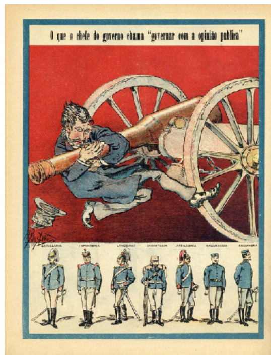
Figura 7: A Paródia , janeiro de 1907

Ao longo dos primeiros meses do novo ano de 1907, a greve académica na Universidade de Coimbra, iniciada em março, a continuidade das polémicas em torno das tentativas governamentais de exercer controlo administrativo sobre a imprensa e uma sucessão de episódios de desordem pública violenta empurraram Franco para o pedido, feito ao rei, de concessão da dissolução parlamentar. Era o que Hintze Ribeiro solicitara a D. Carlos I um ano antes. E contrastando com a negativa dada ao líder regenerador, o rei deu-a ao governo de Franco que, desprovido já do apoio inicialmente prestado pelos progressistas de José Luciano de Castro, assim começou, a partir de meados de maio, a governar em "ditadura" – leia-se, sem parlamento obstrucionista. Com as reformas e o tempo, esperava o líder do governo (e o rei), seria possível agendar novas eleições que, dando-lhe uma maioria, estabelecessem o