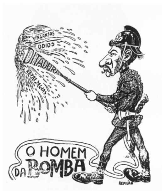
Figura 10: Os Ridículos , agosto de 1907

contra o executivo, muito em reação à lei aprovada a 20 de junho de 1907, que proibia todo qualquer escrito insultuoso e atentatório da ordem, conferindo aos governos-civis poderes para querelar e suspender periódicos por períodos arbitrariamente fixados. Na pena dos críticos, o mundo dos periódicos passara a ser uma barreira que o odiado presidente do governo queria suprimir, “ou “xuprimir”, como se dizia, ridicularizando o sotaque beirão de João Franco 54 . E a governação franquista, crescentemente isolada e dependente de um arriscado favor régio, estava entregue ao “homem da bomba”, que fustigava os portugueses com “vinganças”, “ódios” e “represálias” que governava pelo apito, o bastão ou a espada, e que sepultara assim, sob lápide de pedra, a Carta Constitucional, o parlamento e as liberdades. 55