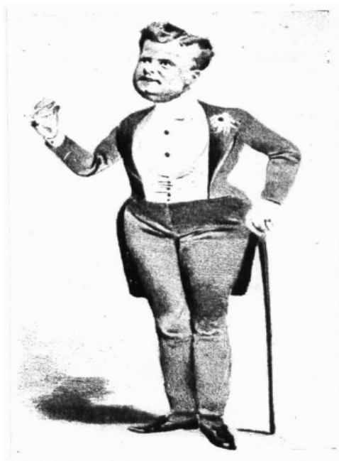
Figura 3: Álbum das Glórias , janeiro de 1885

Foi nestes anos e neste meio que D. Carlos I moldou a sua forma de ser. Nos termos de Fialho de Almeida, “a cordialidade risonhamente fidalga” nos contactos mais estreitos contrastava com o “aspeto bisonho, aborrecido e duro” por ele assumido em público 25 . Apesar de se esforçar por aparecer, e de ter que aparecer muito, D. Carlos I nunca esteve à vontade entre grandes multidões. João Franco, que o conheceu bem, elaborou-lhe um expressivo retrato: “aos primeiros contactos com estranhos, e até em atos oficiais, D. Carlos I deixava por vezes uma impressão de fria reserva”; por isso “ficou sempre, na sua estrutura íntima, um desconheci-