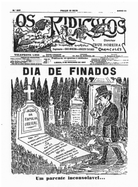
Figura 11: Os Ridículos , novembro de 1907

No dia de Natal de 1907, a 1. a página d' Os Ridículos compunha o desenho de um Franco deitado numa cama, rodeado apenas de polícias façanhudos, tentando um "sono dos justos", na falsa esperança de que "o país" ainda estaria com ele. 56