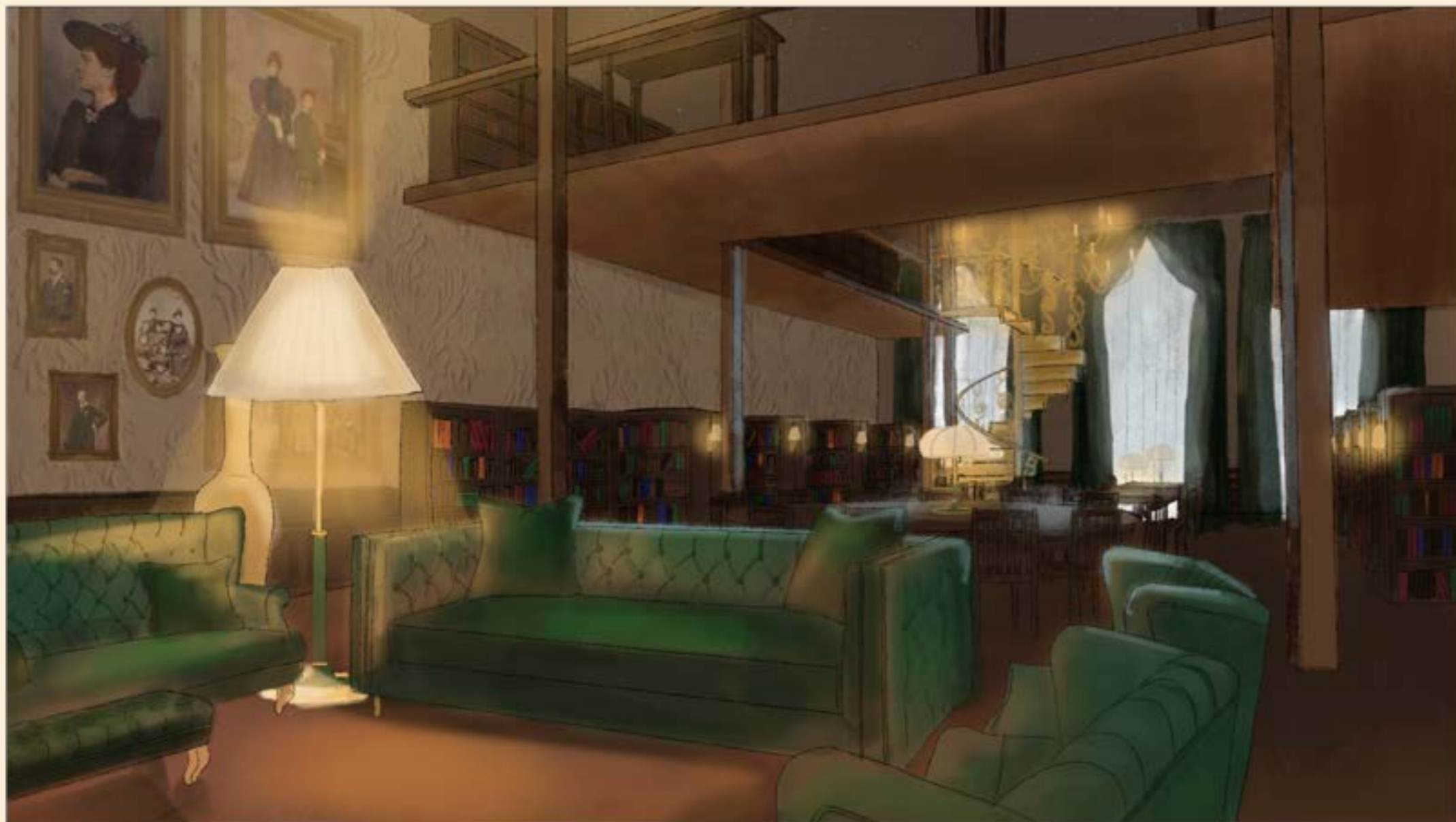
Sociedade de Arqueologia e História da Arte de Inglaterra (SAHAI)