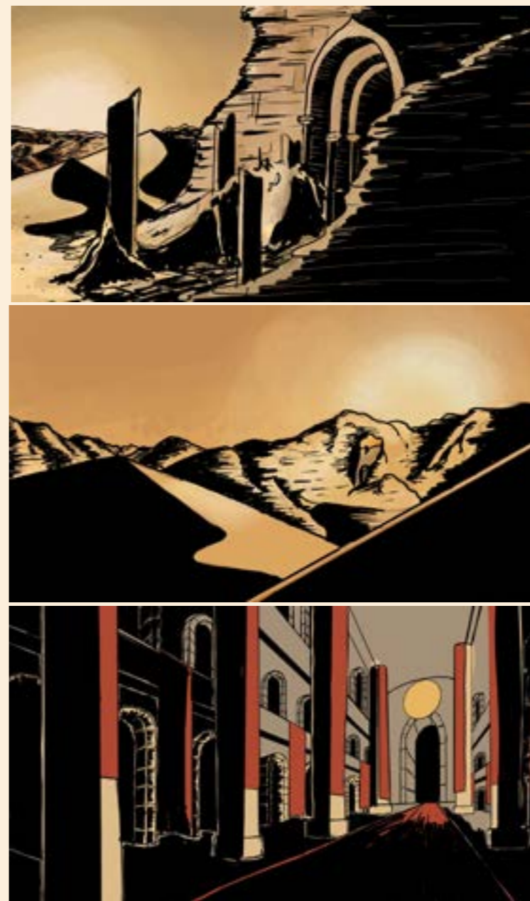
À esquerda: Primeiros conceitos digitais de ambientes: A entrada da cidade, o deserto e a sala de sacrificios.