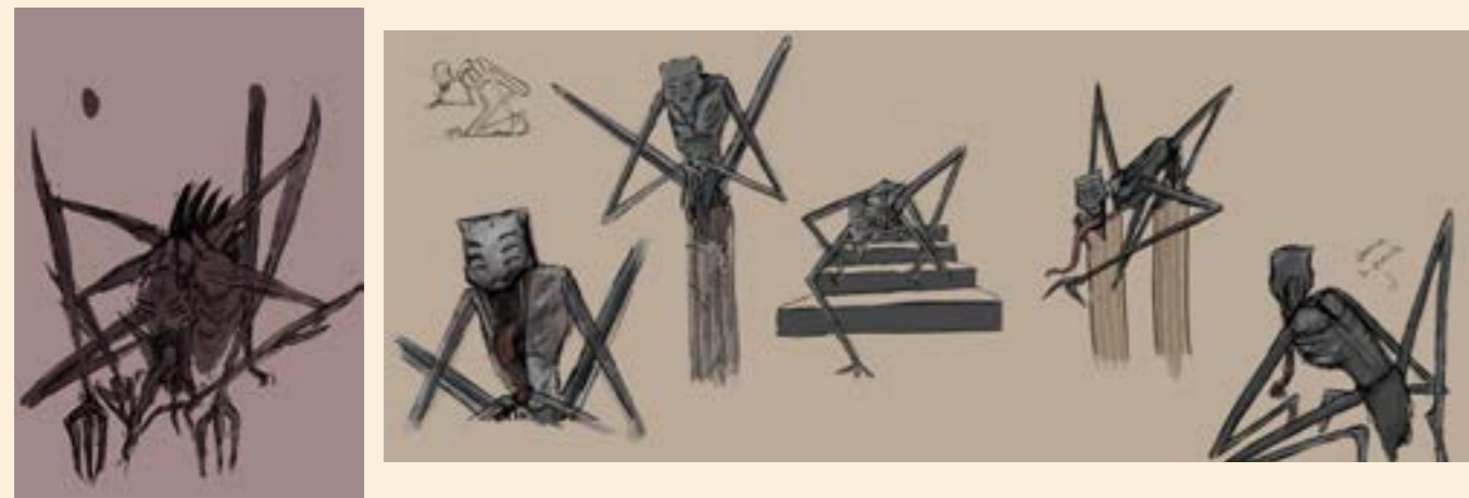
Há esquerda: primeiros estudos do caçador e os seus movimentos.