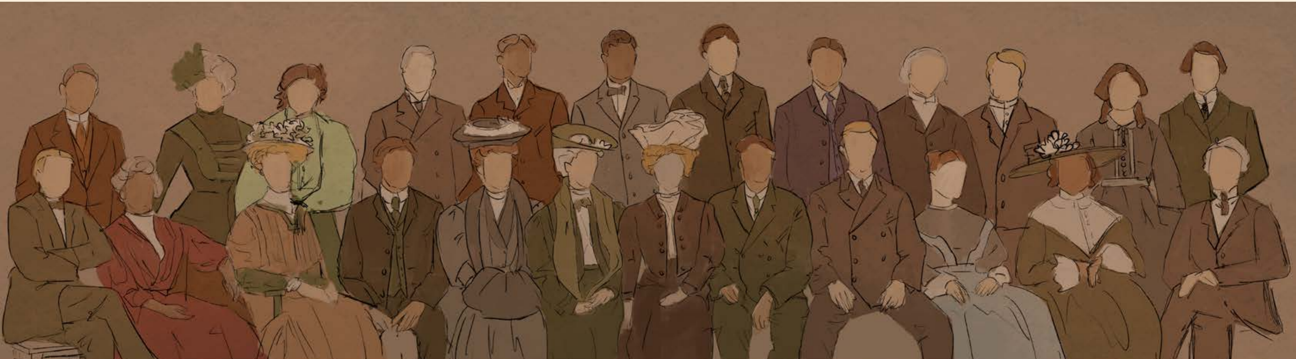
Membros da Sociedade de Arqueologia e História da Arte de Inglaterra (SAHAI)