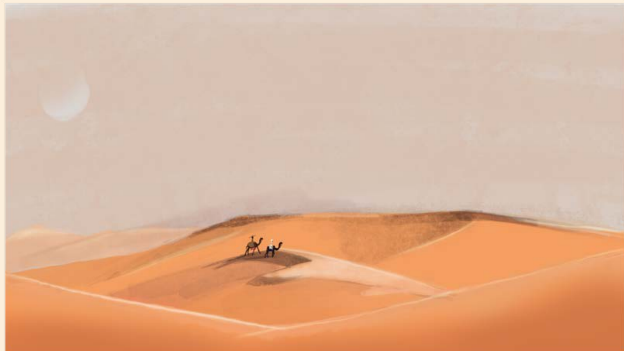
Dália e Khalî- 1º dia de viagem