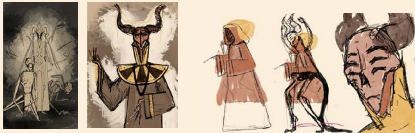
Em cima: Primeiros estudos de sacerdotes.