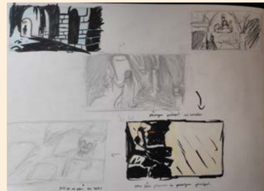
Em baixo: Testes com auxilio de referencias com registo tradicional.