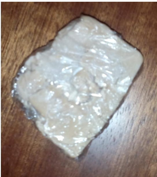
Figura 3 – Fermento.