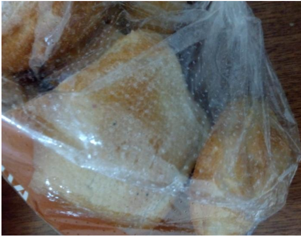
Figura 5 – Pão de trigo.