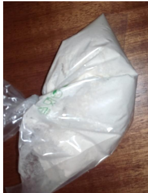
Figura 2 – Farinha do trigo.