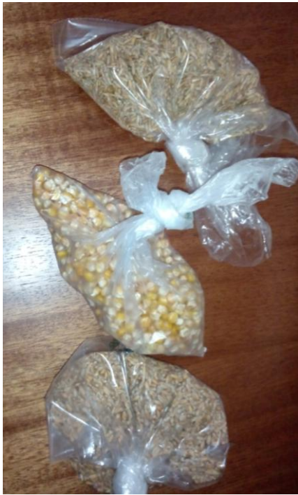
Figura 1- Grãos de centeio, milho e trigo.