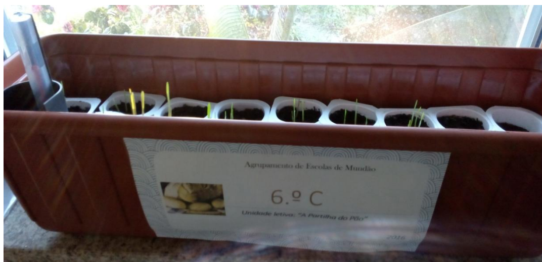
Figura 3 – Os copos dos alunos inseridos num vaso com os grãos a crescerem.