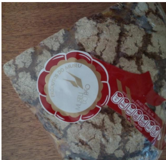
Figura 7 – Pão de milho do “Museu do Pão de Seia”

Anexo 2 – Para o fabrico do pão, a professora apresentou aos alunos diferentes tipos de grãos (centeio, trigo, milho). Depois explicou que destes grãos surge a farinha que é moída, e posteriormente na padaria, juntamente com o fermento e água é amassado e cozido o pão, apresentando diferentes qualidades de pães.