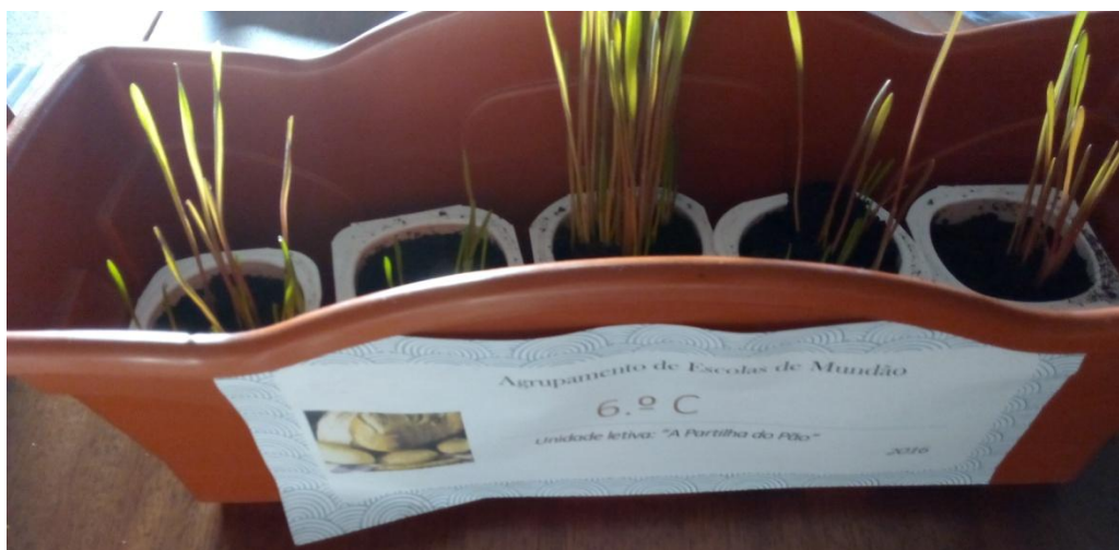
Figura 4 – O crescer dos grãos de outros alunos.

Anexo 3 – Para que os alunos pudessem presenciar o crescimento dos grãos, a professora entregou a cada aluno, dois grãos para semear em copos de iogurte reutilizáveis, na sala de aula.