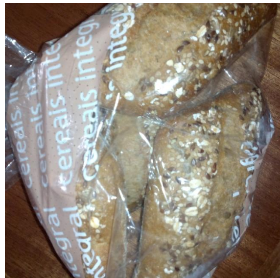
Figura 4 – Pão de mistura com sementes.