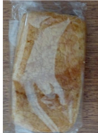
Figura 6 – Pão com chocolate.