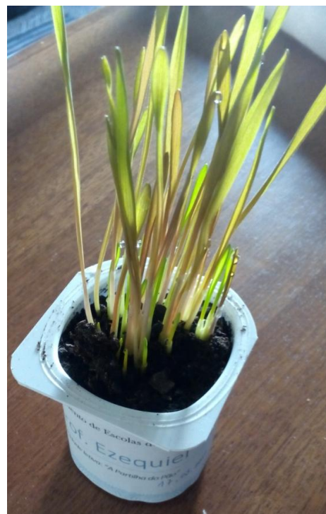
Figura 2 - O crescer do trigo.