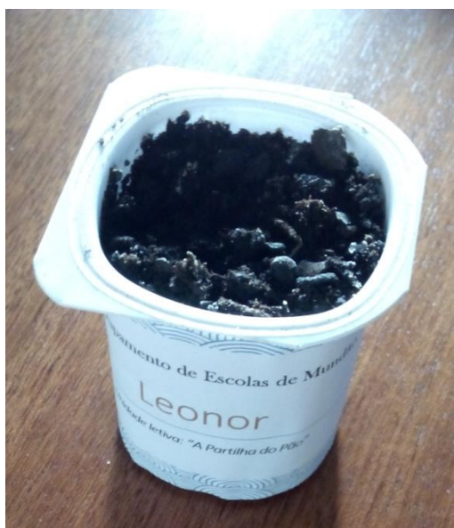
Figura 1- O copo de iogurte reutilizável com as sementes.