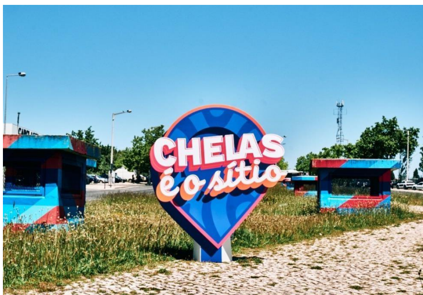
Anexo 2 – Logotipo da Associação “Chelas é o sítio”