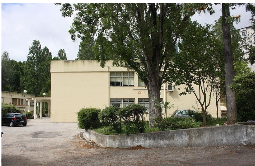
Anexo 1 – Escola Básica Damião de Góis