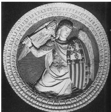
Fig. 5 – Ange avec l'écu du Portugal.

cardinal dans le sommeil tranquille de la mort. Sa vie y est célébré dans l'inscription suivante, pour l'éternité: