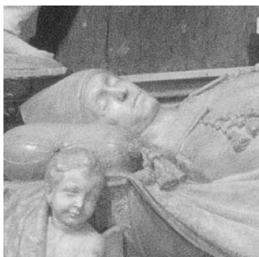
Fig. 4 – Sculpture du Cardinal dans le sommeil tranquille de la mort.