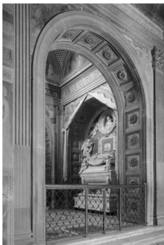
Fig. 2 – Chapelle du Cardinal du Portugal.

Bien qu'il n'ait pas obtenu tout ce qu'il souhaitait, D. Jaime fut libéré et, avec son frère João, il a été accueilli en Bourgogne par sa tante et par le duc, en personne. Ce dernier l'a envoyé en Flandres où il reçut une éducation soignée.