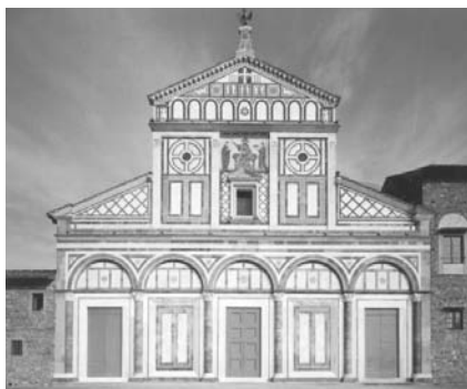
Fig. 1 – Façade de l’abbaye de San Miniato al Monte, un beau classique du gothique florentin.

On prendra surtout comme référence dans cette analyse le matériel narratif. La plus importante de ces sources narratives est constituée par les Vite di uomini illustri del secolo XV 3 , de Vespasiano da Bisticci (1421-1498), texte contemporain consacré à D. Jaime. Parmi les chroniqueurs portugais, c’est Rui de Pina qui, dans sa Chronique de D. Afonso V 4 , donne des informations sur le Cardinal, même si elles sont données de façon fragmentaire. Écrit à la fin du XV e siècle (1495), ce récit est un travail des plus complets et correspond à l’intention de