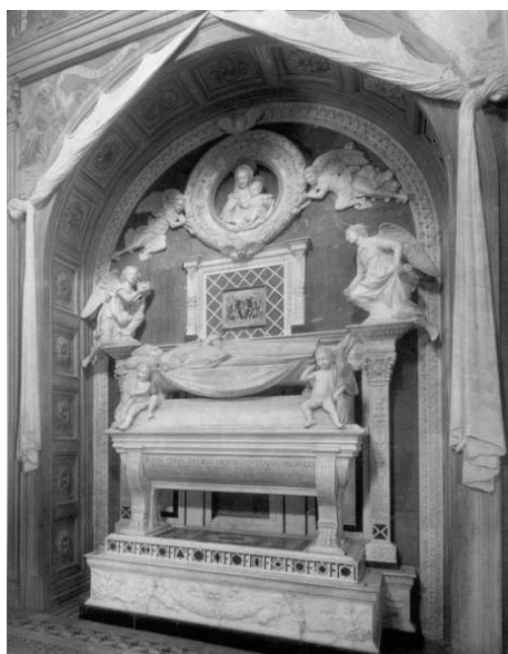
Fig. 6 – Tombeau avec sarcophage, au-dessous l'inscription déjà mentionnée.

REGIA STIRPS . IACOBUS NOMEN . LUSITANIA PROPAGO.// INSIGNIS FORMA. SUMMA PUDICITIA.// CARDINEUS TITULUS. MORUM NITOR. OPTIMA VITA.// ISTA FUERE MIHI. MORS IUVENEM RAPUIT. // VIX(it) AN(nos) XXV M(enses) XI D(ies)X OBIIT AN(no)SALUTIS M CCCC LIX 20