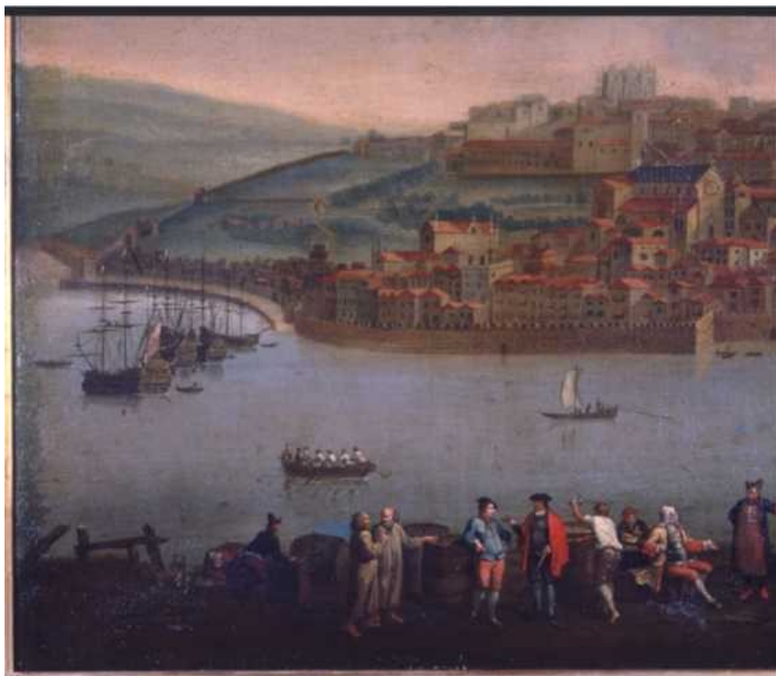
Figura 4. Porto: cidade do vinho português no século XVIII