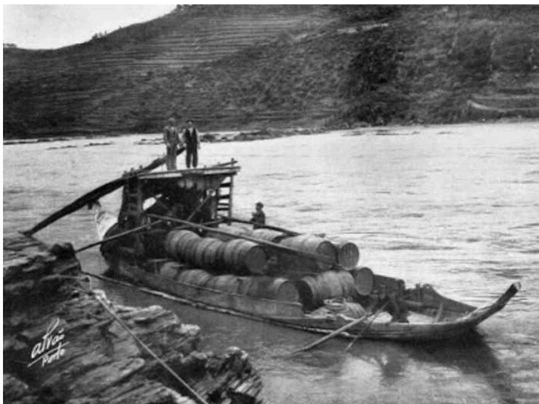
Figura 3. Barco rabelo, Douro