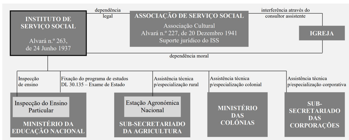
Diagrama 2: Conexões entre o ISS e diversas entidades (1945) 676

poder político instituído, fica explícito que «O Instituto de Serviço Social não é, pois, um organismo do Estado, mas sim uma instituição particular, pertencente à Associação de Serviço Social» 675 , isto, apesar de admitir conexões com vários organismos estatais.