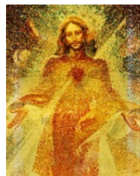
fig. 6 - Autor anónimo: Sacro Cuore di Gesù (2012)