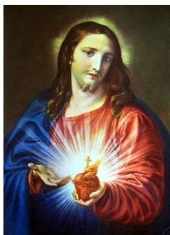
fig. 1 - Pompeo Batoni: Sacro Cuore di Gesù (1767)

monofisismo radical), ou um Cristo humano que não era genuinamente divino (adocionistas). 327