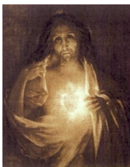
fig. 4 - Henri Pinta: Sacré-Cœur Lumière de la Terre (1921)

«A síntese do Acima e do Para a Frente: a imersão do Divino no Carnal, e, por uma reação inevitável, a transfiguração (ou transmutação) do Carnal numa incrível Energia de Radiação amorosa por tudo e para todos que o queiram acolher de coração desprendido. [...] Assim ele [o Coração de Jesus] torna-se agora capaz, como coisa universalizável, de irromper no Meio cósmico onde estamos a despeito da pobreza da matéria e da condição espiritual que estejamos». 331