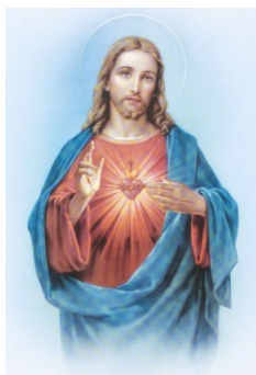
fig. 2 - Autor anónimo: Sagrado Coração de Jesus (fins do século XIX)