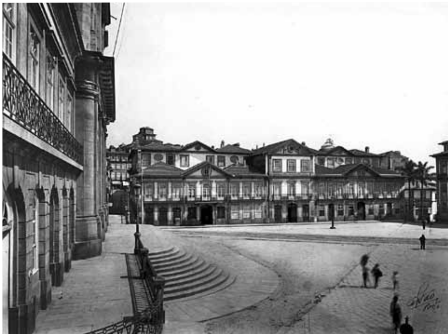
Fig. 2 – Palacete da Família Ferreirinha da Régua (Casa da Trindade) em cujo oratório se realizou o casamento (vide certidão do registo de casamento no final do presente texto).