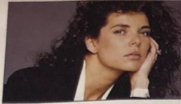
CAROLINA DO MÓNACO

Viver para sempre feliz só acontece às princesas dos contos de fadas. Na felicidade e na adversidade, ela é afinal igual às outras mulheres.