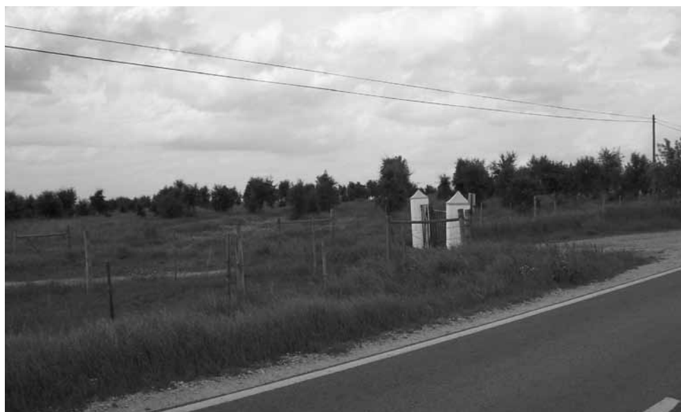
Herdade de Campos em Barbacena.