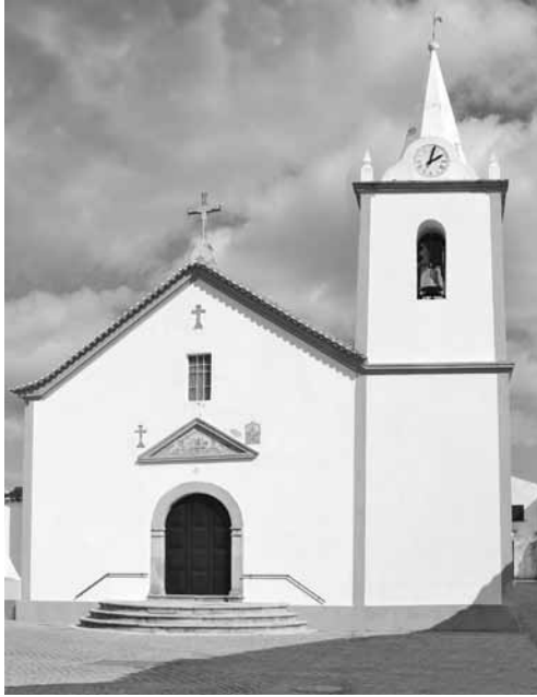
Igreja paroquial de Fratel.

inflamação dos tecidos, inflamação que ainda continua, que eu já só com dificuldade podia sustentar o cibório para a Santa Comunhão 398 .