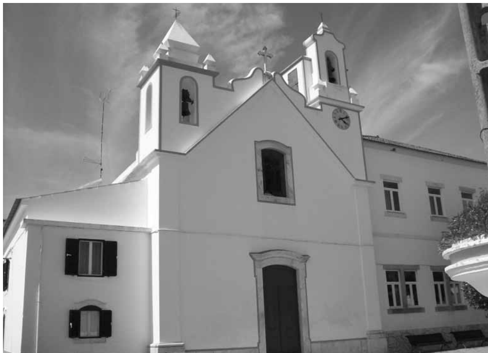
Igreja paroquial de Barbacena.