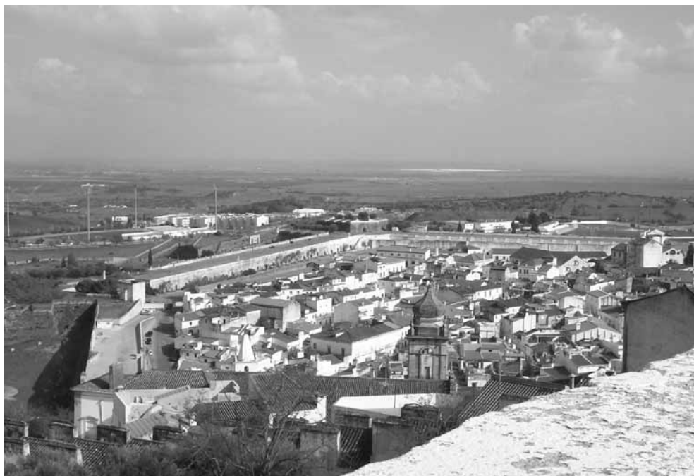
Panorâmica de Elvas, sede do concelho ao qual pertence Barbacena.