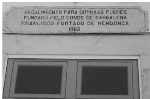
Placa sobre a entrada principal do Recolhimento de Órfãs de Barbacena.

Para navegar entre tais ventos e marés tem de “ concentrar-se na cidadela da sua consciência ” 337 . Mas ela tem territórios limítrofes bem delimitados: acaba por pedir a demissão do cargo de capelão interino do Recolhimento em Fevereiro de 1913, quer à Administração do Concelho, quer ao Governo Civil, que a não aceitam. Por justificação, declara que, além de outras discordâncias, não quer “ por sua parte contribuir para a indisciplina e irregular funcionamento dos serviços do mesmo estabelecimento ”, a que lhe são vedados o acesso e a inspecção 338 .