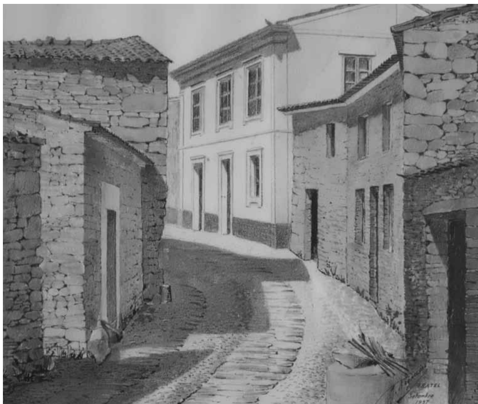
Gravura a tinta-da-china de uma rua de Fratel no início do século XX (autor desconhecido, propriedade da Junta de Freguesia de Fratel).