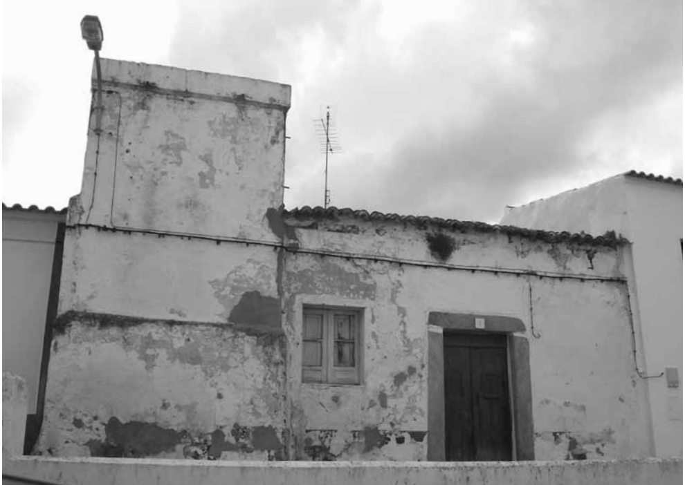
Habitação de um seareiro em Barbacena.

do arcebispo de Évora 236 . E como, apesar de se adensarem as malevolências, o pároco e o advogado apenas desejam a discussão pacífica dos direitos do povo, bom será que os seareiros vão fazendo as suas sementeiras e demais actos de posse habituais, mas serenamente, evitando a todo o transe os “ insultos pessoais e agressões à pedrada, a pau, ou murro ”, até porque “ assim ninguém se pode livrar de processos criminais, por melhores defesas que se aleguem ” 237 . Perante a dificuldade desse esforço de contenção que encomenda ao amigo, raramente deixa de pregar ao pregador, lembrando que “ os outros andam por vaidade e por capricho; nós apenas no cumprimento do dever ”.