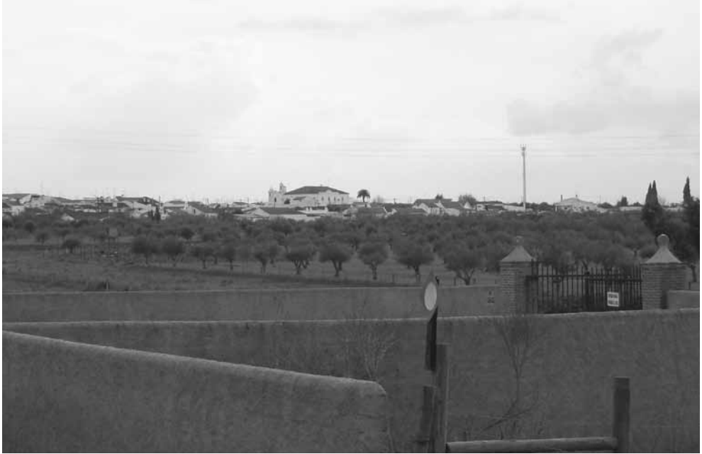
Panorâmica de Barbacena a partir da Herdade de Fontalva.