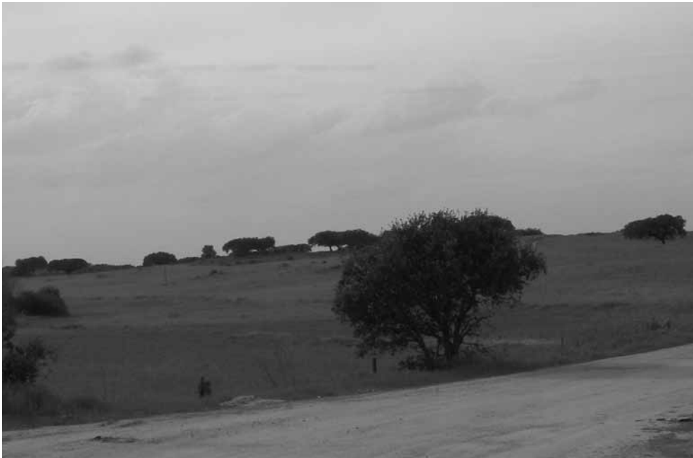
Panorâmica da Herdade de Fontalva.