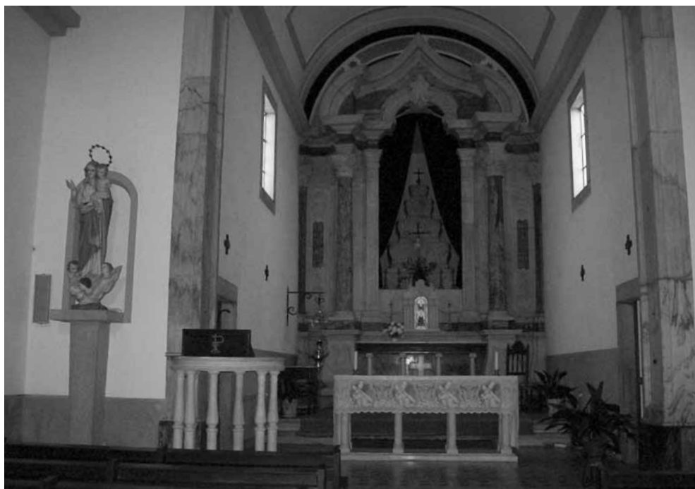
Altar-mor da igreja do Paço, Barbacena.