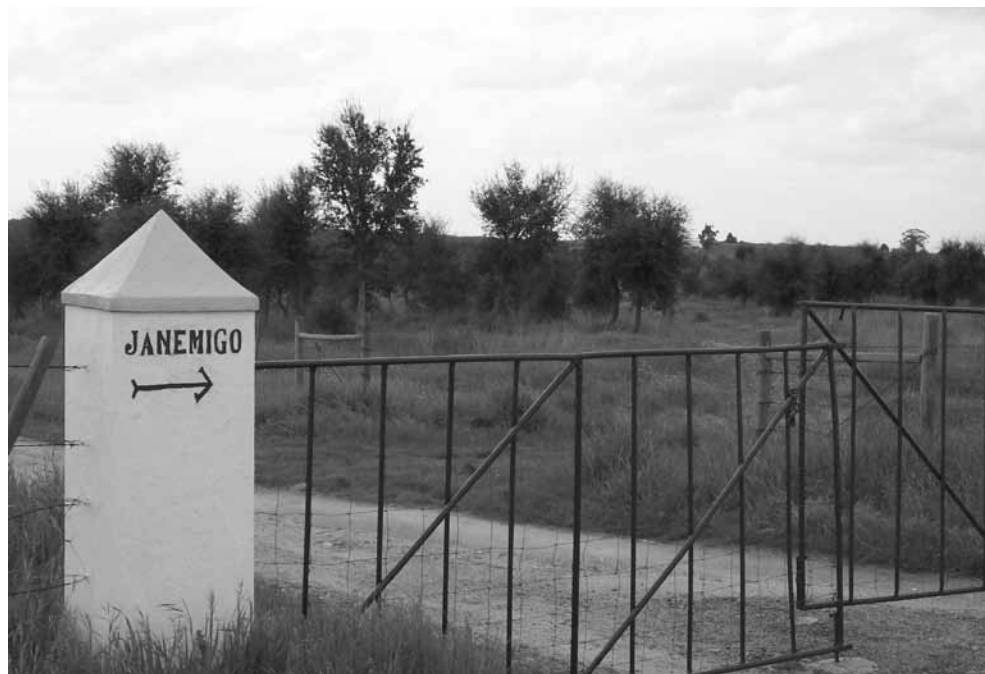
Portão de acesso à Herdade de Janemigo, em Barbacena.