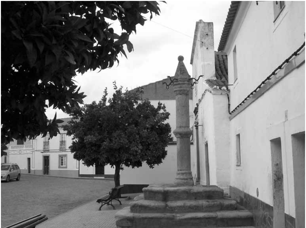
Largo do Pelourinho de Barbacena.