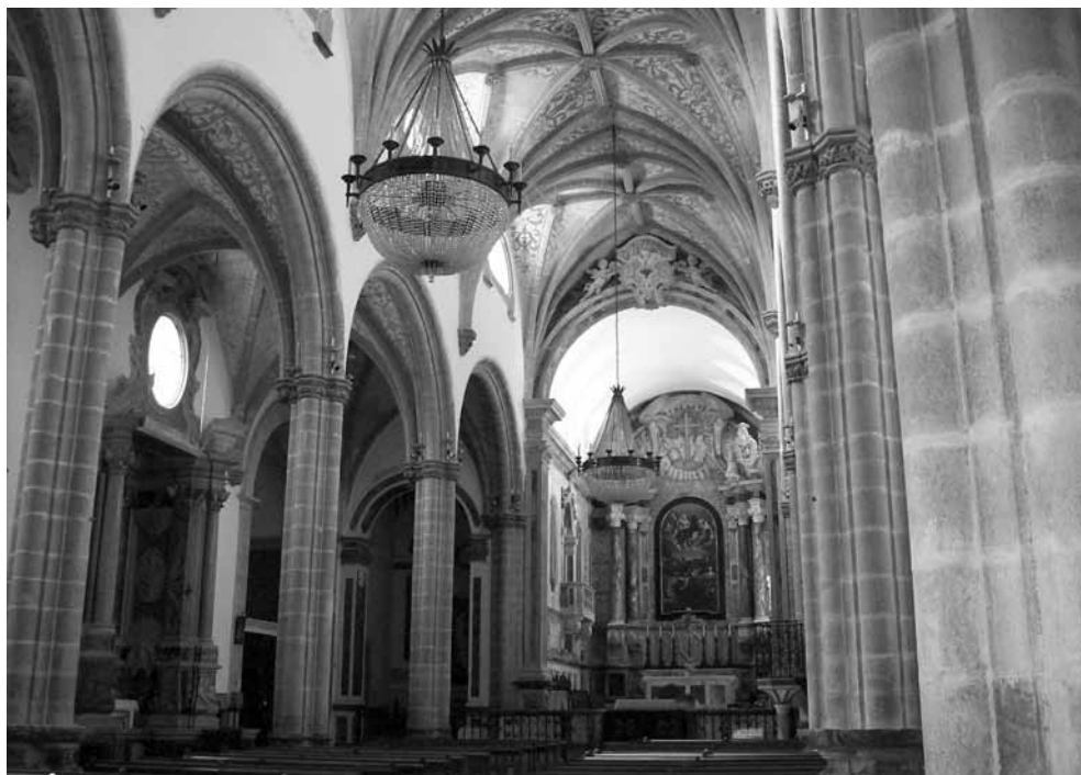
Nave central da antiga Sé de Elvas.