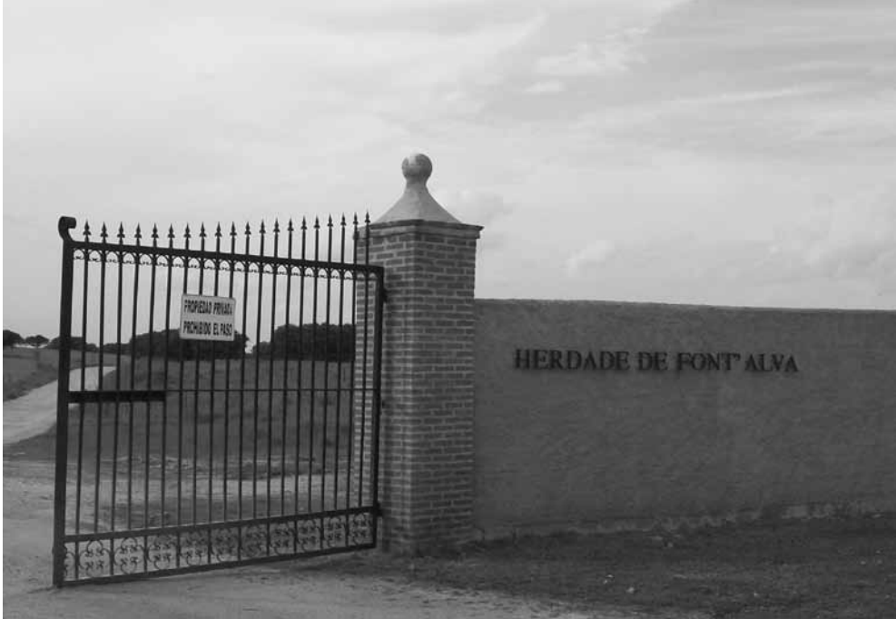
Portão de acesso à Herdade de Fontalva.