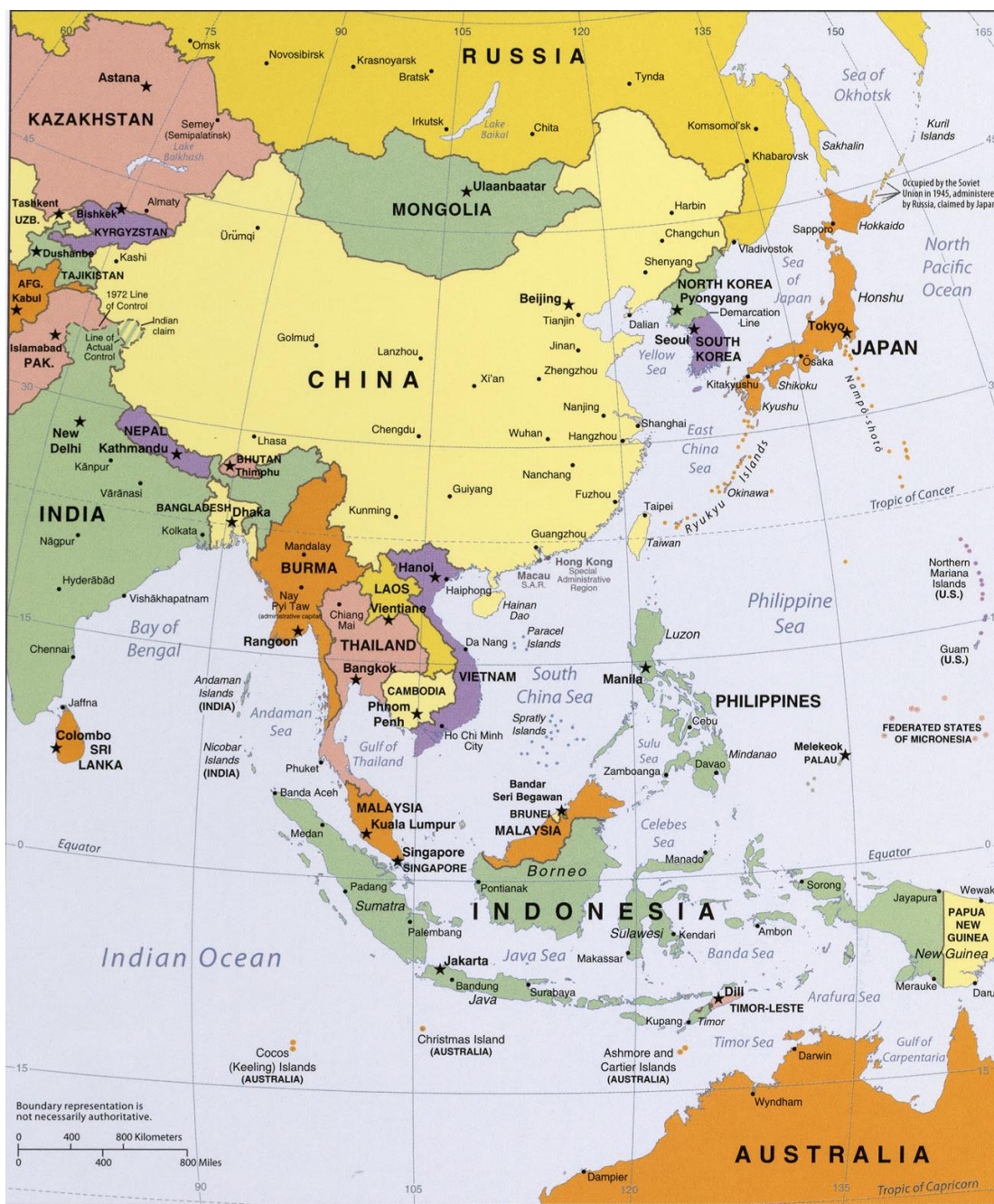
Mapa 3 – A Ásia Oriental.