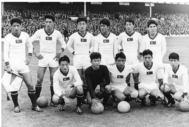
Figura 1 - A equipa norte-coreana no FIFA World Cup de 1966, em Inglaterra, que defrontou Portugal, perdendo por 5 – 3.

A unificação nacional era usada com o intuito de manter a legitimidade política dos regimes autoritários sul-coreanos, afirmando-se como “[...] guardians of national unity [...]” (Lee, 2018b: 267) de toda a Coreia. O período de preparação dos Jogos Olímpicos nos anos 1980, em Seul, ocorreu neste registo nacional e a situação da Península Coreana também se encontrava sob a influência do período de Guerra Fria (1947 – 1991). Na altura, foi a segunda vez que um país do Continente Asiático acolheu os Jogos Olímpicos (Kim, 2017a).