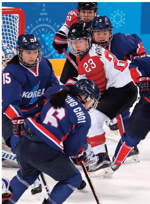
Figura 4 - Equipa de hóquei no gelo feminino da Coreia unificada. A Coreia perdeu por 4: 1 contra o Japão.

No decorrer dos Jogos Olímpicos de PyeongChang a equipa de hóquei unificada, com o nome KOREA, teve três jogos: um contra o Japão, outro contra a Suécia e ainda com a Suíça. Na Figura 4 observamos a equipa feminina unificada de hóquei no gelo durante o jogo contra o Japão. O conteúdo fotográfico que observamos na Figura 4 não é neutro. Através desta fotografia é possível afirmar que estamos perante um momento influenciado e criado pelo governo de Moon para visualizar uma mensagem (Bate, 2009). Analisando esta equipa à luz do Construtivismo social, trata-se da reprogramação da identidade coreana (Choi, 2010). Justamente, a presidência de Moon Jae In tentou substituir a ideia da relação das Coreias como dois Estados diferentes pela ideia de identidade étnica. Através da imagem fotográfica vemos a mensagem de uma Coreia igualitária, que partilha a mesma história. O jogo entre a Coreia e o Japão é peculiar neste sentido. Dias antes do torneio contra o Japão, uma atleta sul-coreana da equipa ‘KOREA’ expressou a vontade de a vitória contra o Japão ter um significado superior ao espírito desportivo nos Jogos Olímpicos: “ The North Korean