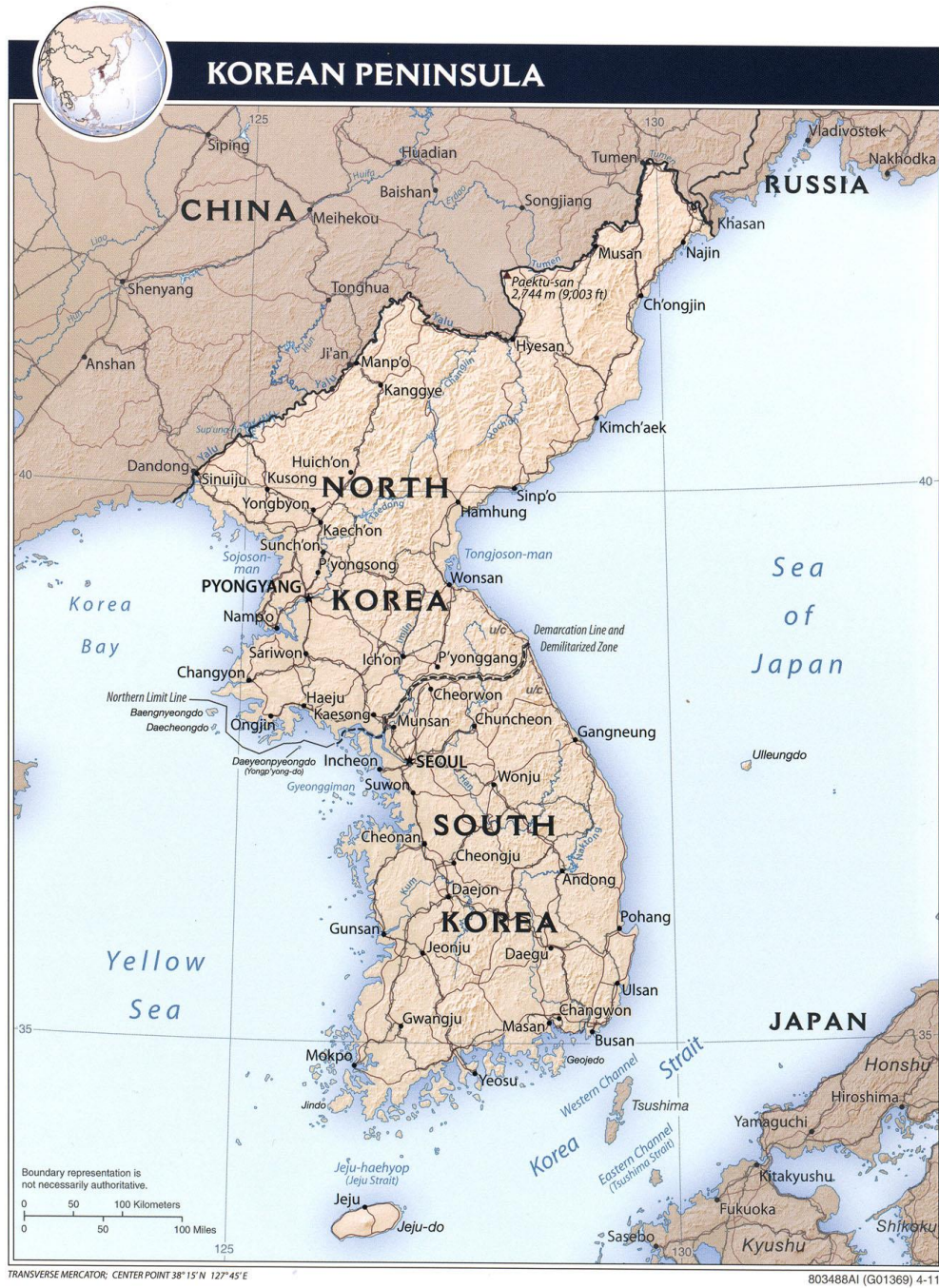
Mapa 1 – A Península Coreana.

Seul é a capital da Coreia do Sul. Pyongyang é a capital da Coreia do Norte.