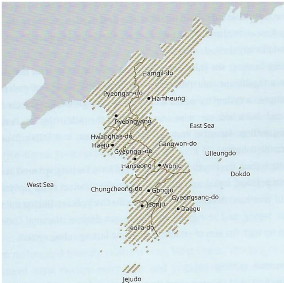
Mapa 2 – A Península Coreana na Dinastia Joseon (séc. XV).

A dinastia Joseon foi a última na Coreia até à invasão japonesa da Península. A Capital da Coreia era Hanyang, atual Seul.