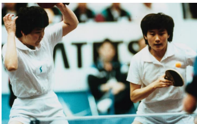
Figura 3 – A equipa feminina coreana de ténis de mesa. À direita está a atleta sul-coreana Hyun Jung Hwa e à esquerda está a atleta norte-coreana Li Bun Hui. A Coreia derrotou a equipa chinesa por 3:2. Fonte: Revista Koreana.

Na Coreia do Sul, durante o período dos anos 90 até ao início da Sunshine Policy (1998), interessava às administrações conservadoras sul-coreanas recorrer ao soft power do desporto para a propaganda política de que a Península teria de ser unificada pela absorção da Coreia do Norte (Kang, 2018b). Nesta altura, a visualidade como estratégia política do soft power era utilizada pelos governos sul-coreanos para comunicar à sociedade nacional a mensagem de uma possível e próxima unificação da Península pela absorção do Norte (Shin, 2014c; Kang, 2018b). Os desportos coletivos masculinos, como o futebol, eram disputados entre as Coreias com o nome “jogos de unificação” (Kang, 2018b). Os jogos ocorriam com equipas separadas, do Sul e do Norte da Península. Paralelamente, foi nas competições internacionais de desportos coletivos femininos que se formaram as primeiras “equipas unificadas”. Em 1991, o campeonato mundial de ténis de mesa em Chiba, Japão, acolheu a primeira equipa feminina das Coreias (Figura 3).