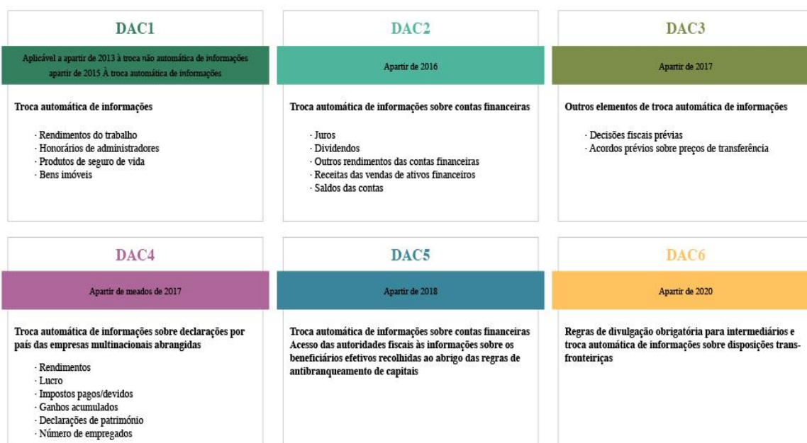
Figura 2 – Fortalecimento do novo paradigma da troca automática

Importa referir que a DAC se tornou aplicável a todos os EM a partir de 2013 e consiste na principal caixa de ferramentas ao nível da cooperação administrativa no âmbito da tributação direta ao dispor das Administrações fiscais na UE.