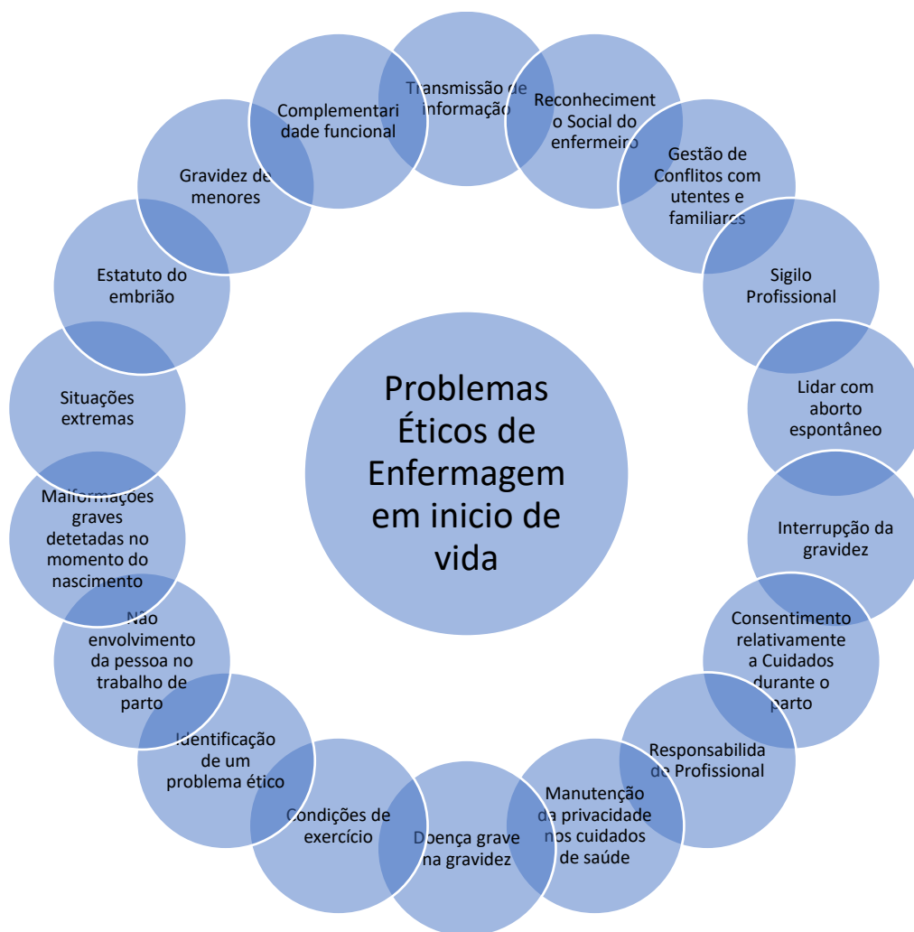
Figura 4 - Áreas problemáticas em que se inserem os problemas éticos de enfermagem em início de vida.

Em todos os problemas éticos apresentados, coloca-se um denominador comum, ou seja, o que se torna problema ético para o enfermeiro é a defesa da saúde e bem-estar da pessoa de quem cuida, e a incerteza de como agir, no sentido de exercer essa proteção, confirmando-se a definição de problema ético de Deodato (2014).