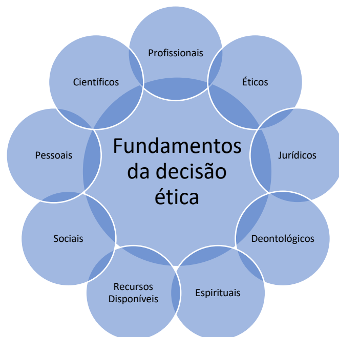
Figura 5 - Fundamentos da decisão ética de enfermagem.

ninguém nasce enfermeiro, decorre que se aprende a ser. O que abre portas para a temática da educação (...) e para a aprendizagem contínua, como hoje se dirá, ao longo da vida. Mas também à aprendizagem pelo exemplo, do bom exemplo. Se quisermos dizer de outro modo, o Si profissional é aprendido e vivido, realimenta os aprendidos e os pensados (Nunes, 2011, p. 107).