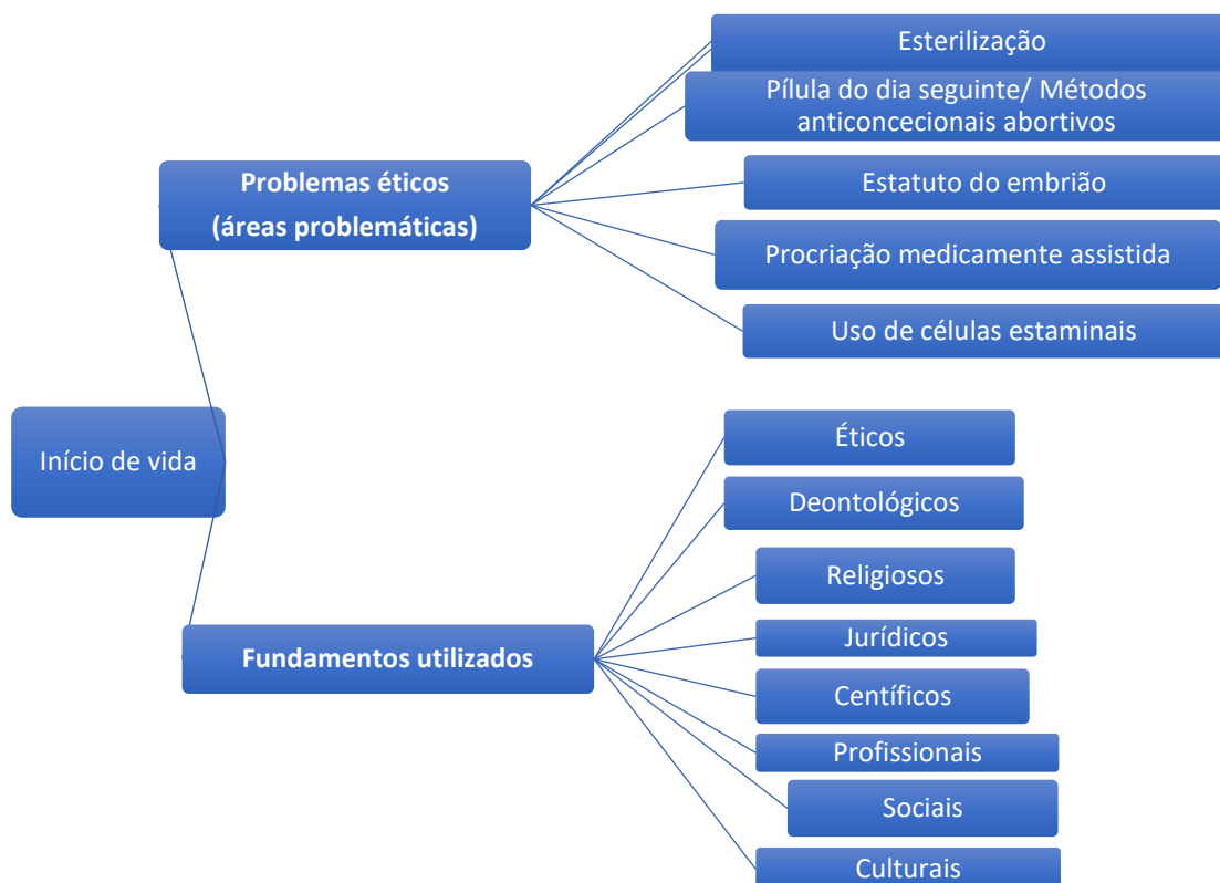
Figura 1 – Resultados dos problemas éticos e dos fundamentos identificados na revisão integrativa da literatura.

Relativamente aos fundamentos de ação de início de vida, podemos afirmar que, com a revisão da literatura, não obtivemos novos dados, pois quase todos os textos analisados apontam para a necessidade de se fundamentar as decisões dos profissionais. É também frequente a referência à necessidade de se respeitar os hábitos culturais das populações com que os profissionais se relacionam. Parece também notória a escassa produção nesta área do conhecimento em enfermagem. Apresentamos estes resultados na Figura 1.