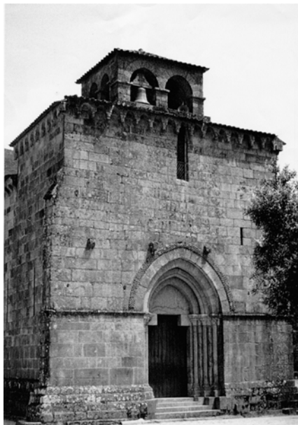
Fig. 5 – Cenóbio e Igreja de S. Martinho de Mouros – Concelho de Rezende.