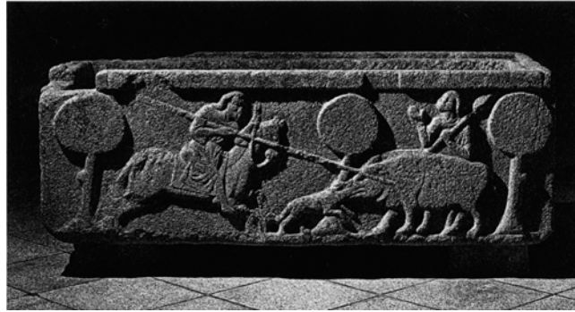
Fig. 1 – Arca tumular existente no museu de Lamego.

séc.X, sendo um dos mestres o possível autor das superfícies em relevo da referida arca tumular do Museu de Lamego?