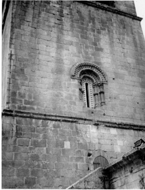
Fig. 3 – Lamego - janela nascente do Paço do Bispo de Lamego.