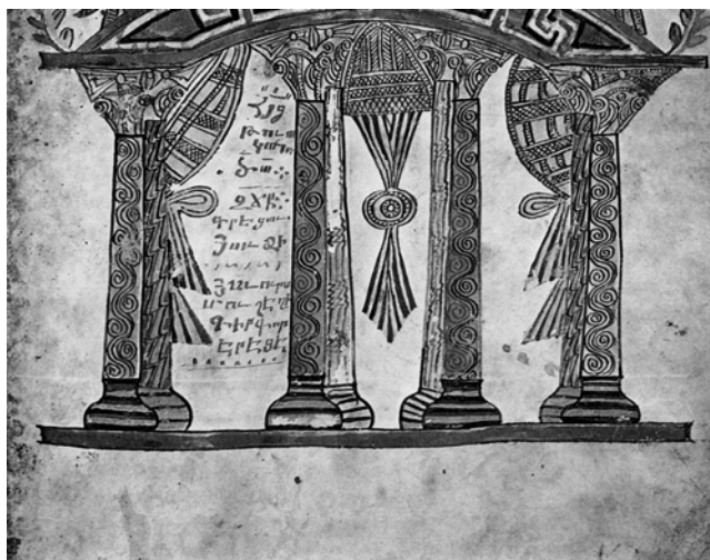
Fig. 6 – Evangelho, séc. XI - Jerusalém – Patriarcado arménio.