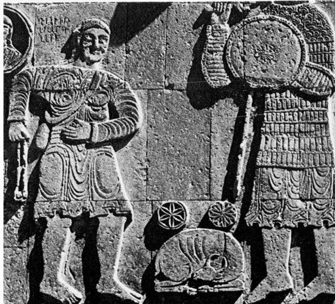
Fig. 2 – Parede exterior da Igreja de Santa Cruz em Aght'amar (actual Turquia).