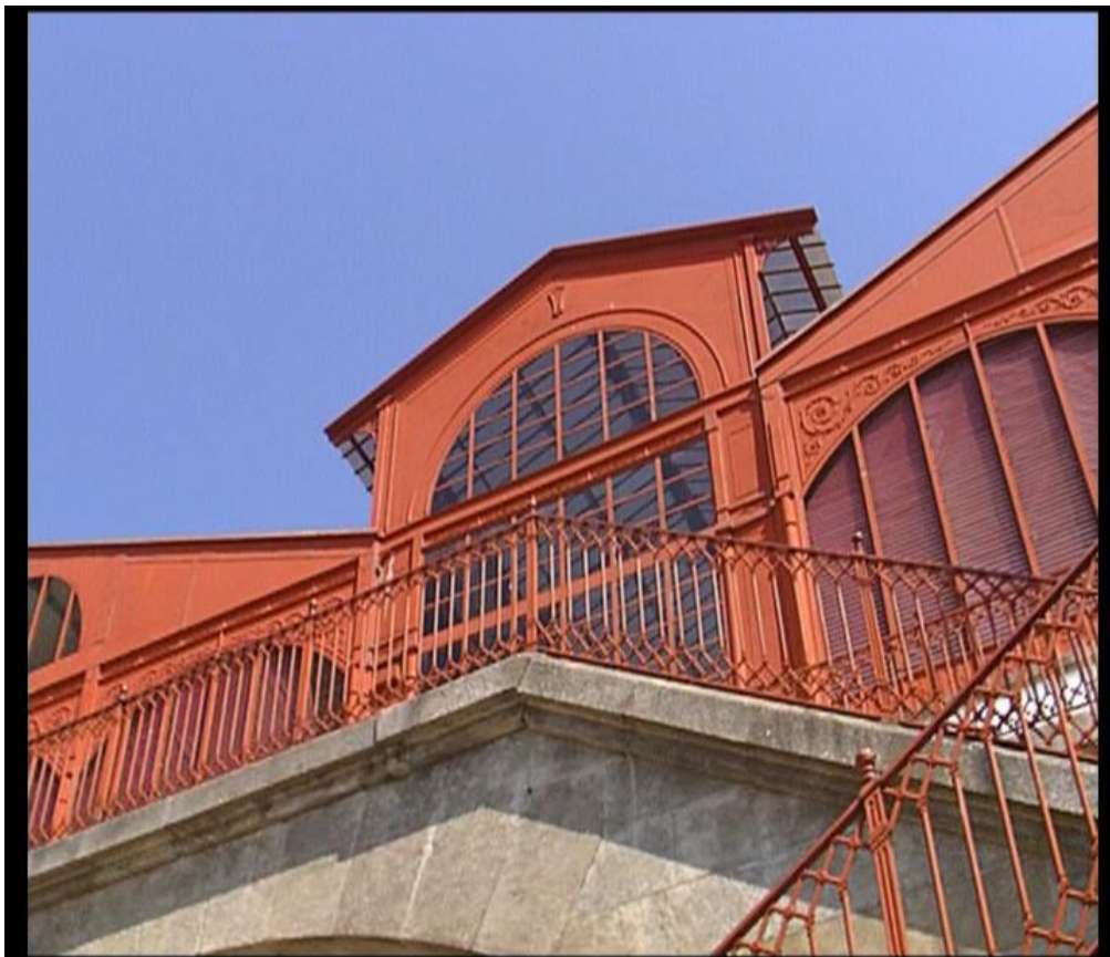
Fig.11 – Mercado Ferreira Borges - “Um olhar sobre o Porto”,2006

Outro dos problemas na produção foi o de ter o tempo muito limitado para cada tomada de recolha de imagens, nem sempre nos foram cedidas condições para efectuarmos o trabalho, muitas vezes ao final de um mês de constantes telefonemas era nos concedido o equivalente a duas a três horas para efectuarmos as imagens, o que não deu margem para que fossem cometidos erros quanto aos planos que se cria obter no interior, para tal tinha que ter um projecto muito bem delineado para que o mínimo de erros ocorresse. Foi feita uma pesquisa por tudo o que havia de livros sobre cada edifício, estudadas fotografias obtidas por anteriores fotógrafos em cada um dos edifícios, tentei fazer um esboço de cada plano efectuado e que foi colocado num story-board , para que em cada local a onde fossemos houvesse uma planificação o mais aproximada do resultado final, não permitindo assim, que se deambulasse nos espaços sem saber que planos realizar, evitando as perdas de tempo.