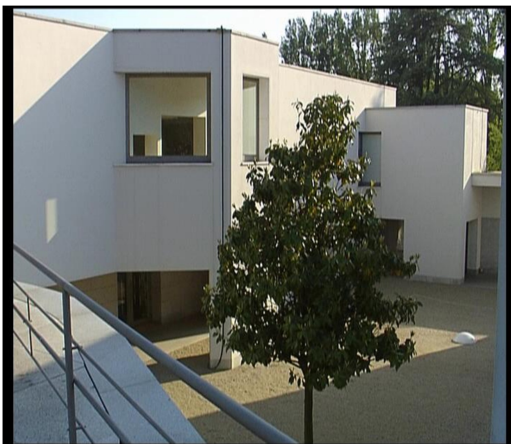
Fig.17 – Pormenor Museu de Serralves - “Um olhar sobre o Porto”,2006

Sem nunca perder de vista as relações que se estabelecem entre o projecto artístico e o meio ambiente a onde se enquadra que neste caso é a cidade e que nela habita criando assim um conhecimento da estética compartilhado a que Allen Carlson 34 se referencia.