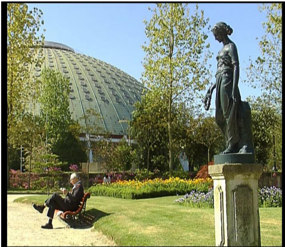
Fig.13 – Pormenor Palacio de Cristal - “Um olhar sobre o Porto”, 2006

marginal de Gaia e as Caves de vinho do Porto. No quinto dia o Museu do Carro Eléctrico, o Museu do Vinho e a Torre dos Clérigos. No sexto dia, o Jardim dos Clérigos, a Livraria Lello e a Praça dos Leões, No sétimo dia, a Rotunda da Boavista, o monumento da Rotunda da Boavista, o Centro Comercial Península. No oitavo dia o museu Soares dos Reis, a rua Miguel Bombarda e as Galerias da Rua Miguel Bombarda. Ao nono dia o Museu Romântico e o Museu de Serralves. No decimo dia a Avenida da Boavista, o Parque da Cidade e a Foz. Os restantes dois dias foram utilizados a recolher imagens dos mesmos locais que por um motivo ou outro não correram bem.