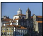
Fig.6–Sé do Porto – “Um olhar sobre o Porto”,2006, pág.42