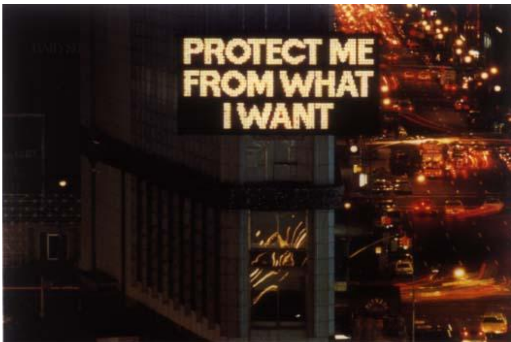
Fig.1 –“Messages to the Public”, Jenny Holzer,1986

O objectivo principal de um banco de dados é fornecer uma interface para tarefas de processamento de informação para trazer os registos relevantes, alguns dos quais podem ser incorporados em outras bases de dados através de um processo de migração de dados utilizando tecnologias de partilha.