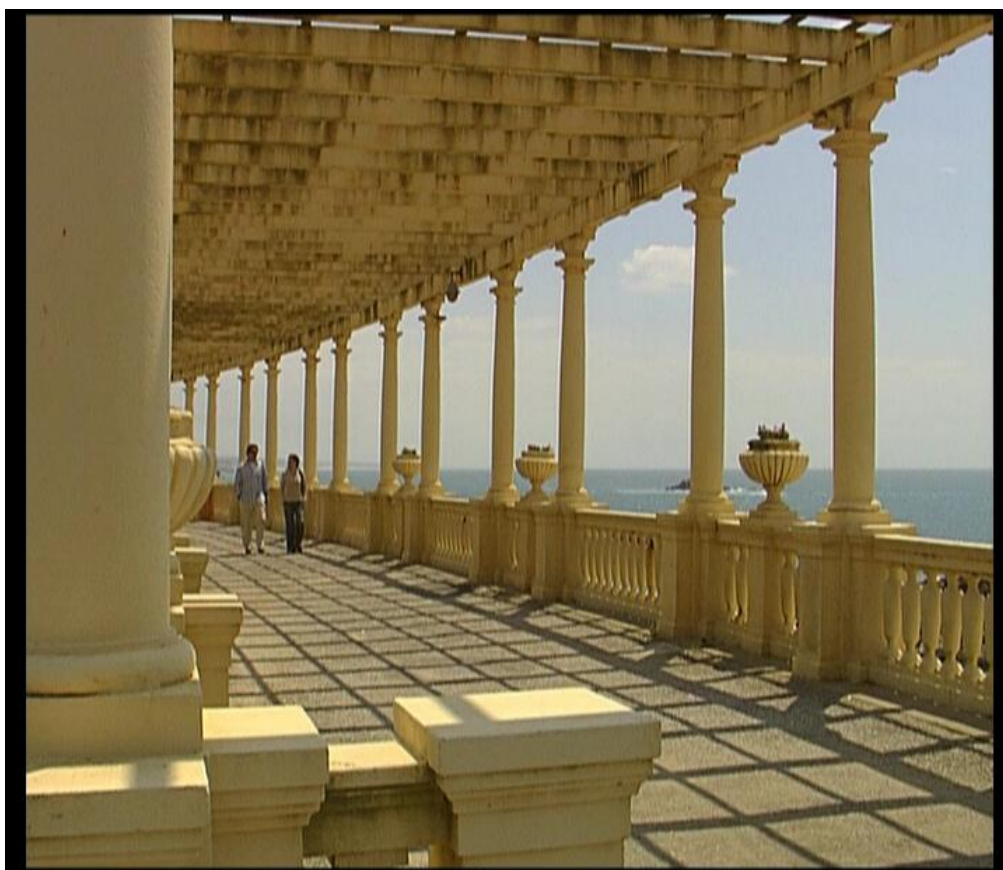
Fig.20 – Pergola da Foz - “Um olhar sobre o Porto”,2006

Mais tarde foi feito uma tentativa para um outro acordo com a mesma empresa FNAC, para a inclusão das suas imagens abordo dos aviões da companhia aérea TAP, de forma a promover a sua imagem junto da classe executiva abordo dos aviões, mas infelizmente tal acordo acabou por não se realizar.