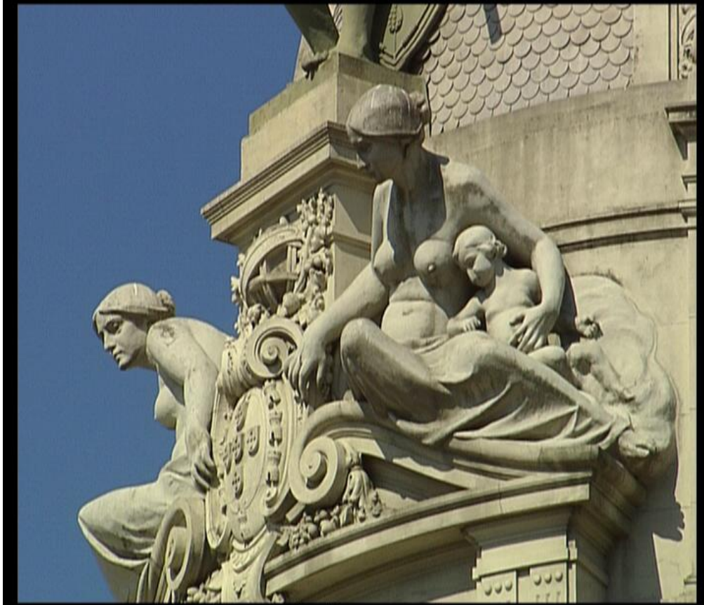
Fig.7– Pormenor Av. Aliados - “Um olhar sobre o Porto”,2006