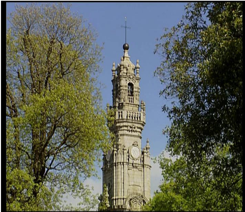
Fig.5 – Torre do Clérigos – “Um olhar sobre o Porto”, 2006