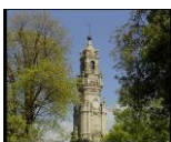
Fig.5 – Torre do Clérigos – “Um olhar sobre o Porto”, 2006, pág.40