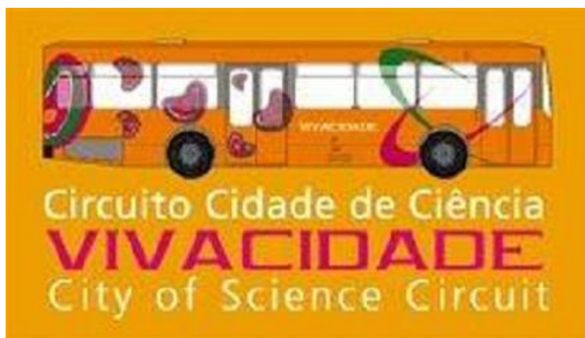
Fig.19 – logo “Vivacidade”- Porto cidade da ciência, 2006

viagens do autocarro, um monitor dentro do autocarro e a apresentando imagens do projecto Um olhar sobre o Porto .