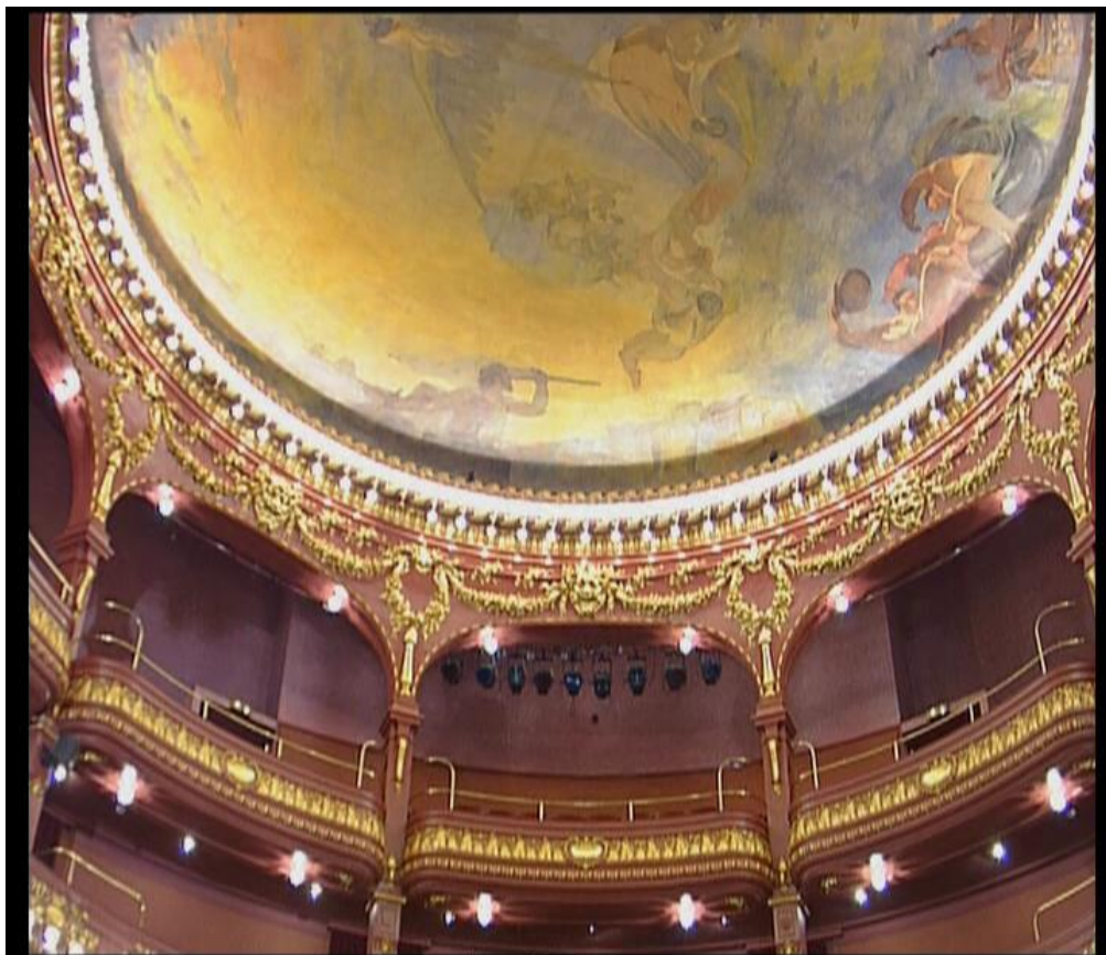
Fig.14 - Pormenor Teatro S. João - “Um olhar sobre o Porto”,2006

uma capa original que fica na memória de quem a vê, não creio que fique muito datada com o passar do tempo caindo num vulgar passar de moda.