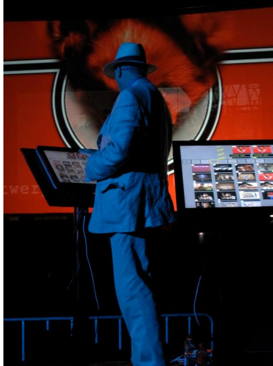
Fig.3 –“Lupercyclopedia”,Peter GreenWay,2009

Outro projecto que influenciou esta projecto foi o filme documentário Baraka 20 , (fig 4), Ron Fricke de 1993. Mais do que um filme trata-se de repositório de imagens pelos cinco continentes do globo. É um filme sem diálogos que vive totalmente da imagem, conseguindo de uma forma magnífica despertar consciências para os problemas presentes do planeta terra. Filme de tecnologia e consciência foi filmado em vinte e quatro países com uma música portentosa é um exercício de consciencialização planetária.