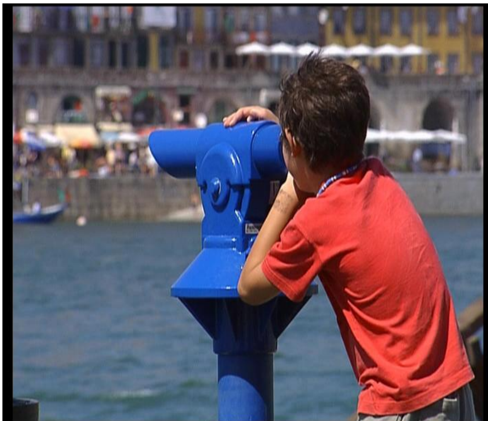
Fig.21 – Pormenor Douro - “Um olhar sobre o Porto”,2006