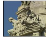
Fig.7–Pormenor Av. Aliados - “Um olhar sobre o Porto”,2006, pág.45