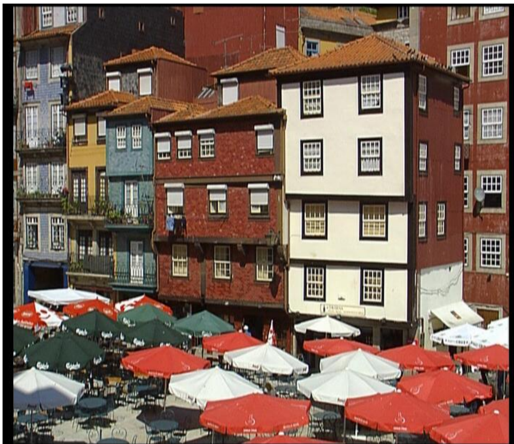
Fig.9 – Ribeira do Porto - “Um olhar sobre o Porto”, 2006