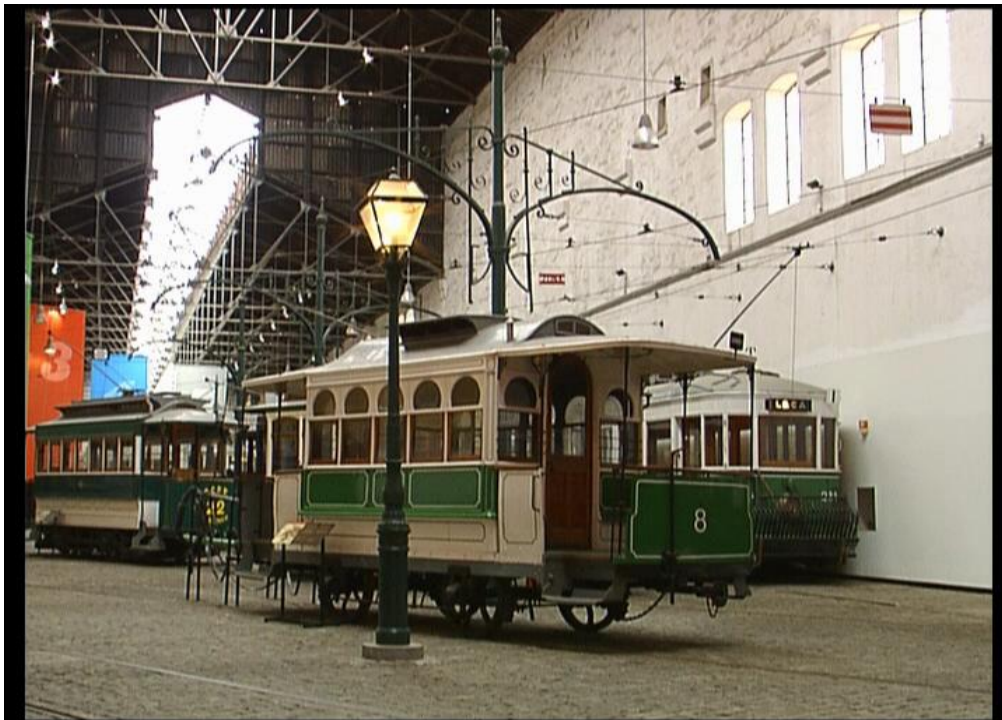
Fig.18 – Museu de Eléctrico - “Um olhar sobre o Porto”, 2006

Sendo que as imagens para primeira classe tiveram mais dez minutos de imagens que na classe turística e ao contrário desta última tinham voz off incluída com narração dos locais e música em background. Para a classe turística foi usada a mesma versão do percurso Lisboa -Porto a onde o som não existia e estava reduzida a vinte minutos de imagem por imperativos de duração da própria viagem que dura muito pouco tempo. No final a exibição das imagens singrou-se num enorme sucesso fazendo aumentar a procura da versão em DVD do trabalho, e segundo números da TAP foi visto por um milhão e duzentos mil passageiros durante os meses que esteve a bordo dos aviões, provando mais uma vez a flexibilidade e adaptabilidade deste projecto baseado no conceito de Blocos de Imagens . O facto de que apesar do destino das imagens ser a mesma, umas terem som incluído no caso da primeira classe e na classe turística proporcionou uma experiência no diálogo estabelecido com o público total mentalmente diferente dentro do mesmo local e com as mesmas imagens, tendo o público no primeiro caso e por estar incluído uma voz-off, uma experiência mais cognitiva e no segundo caso uma experiência mais sensorial, mas como Allen Carlson afirmam ambas partilhando de uma mesma experiência estética.