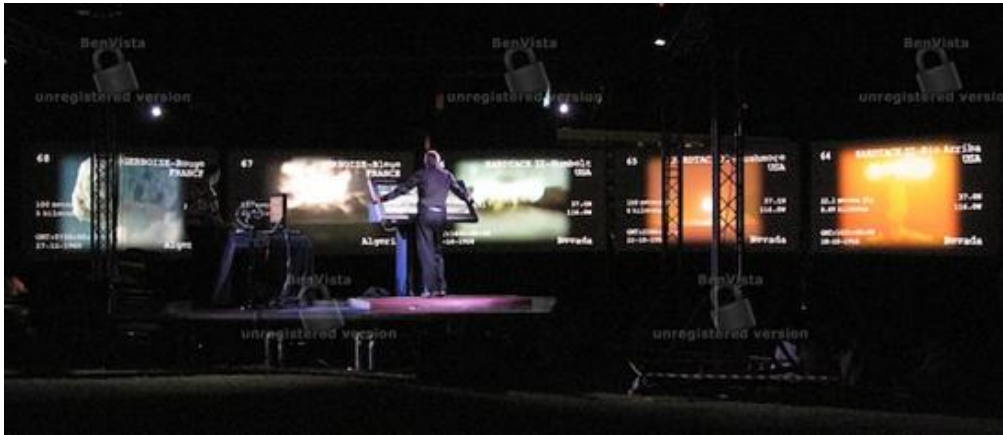
Fig.2 –“Lupercyclopedia”, Peter GreenWay,2009