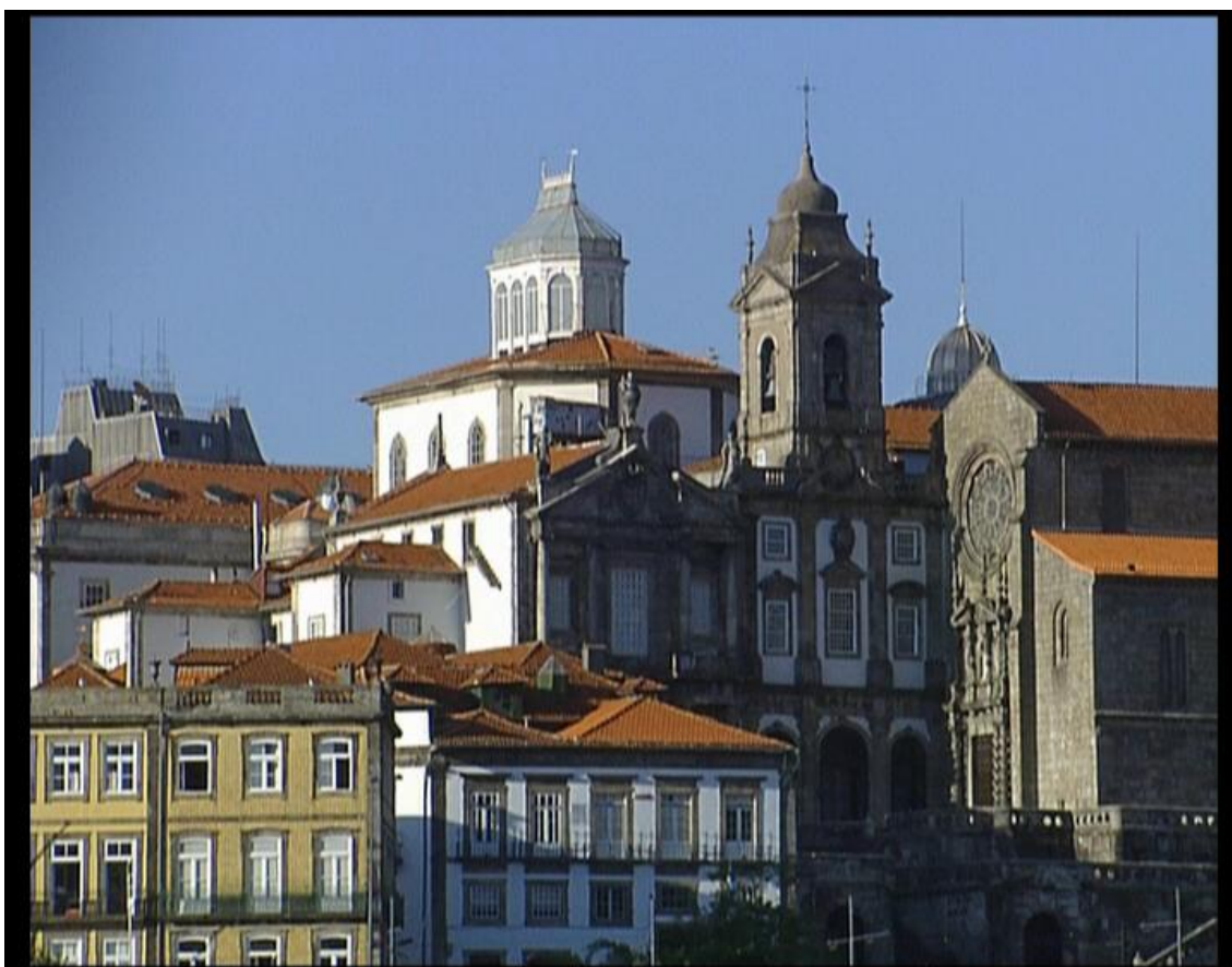
Fig.6 –Sé do Porto – “Um olhar sobre o Porto”,2006

A preocupação da contextualização do individuo com o ambiente foi sempre uma preocupação como no caso do Museu de Serralves, da rua das galerias de Miguel Bombarda ou do Museu Soares dos Reis que apesar do espectador na se encontrar numa posição de apreciação directa da obra, colocamo-nos na terceira pessoa com o sentido de sublime de Berleant numa visualização à distancia.