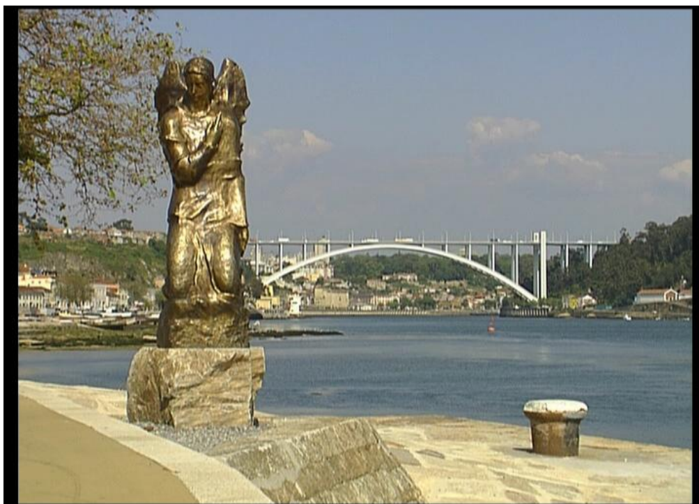
Fig.8 – Marginal Douro - “Um olhar sobre o Porto”, 2006

terceiro grupo dos cinquenta em diante que normal é saudosista e procura produtos que o recordem lugares e viagens passados ou que lhe tragam laços de ligação á terra a onde vive. Incluiria aqui um quarto grupo que são os turistas que procuram obter sempre imagens de qualidade dos sítios a onde estiveram.