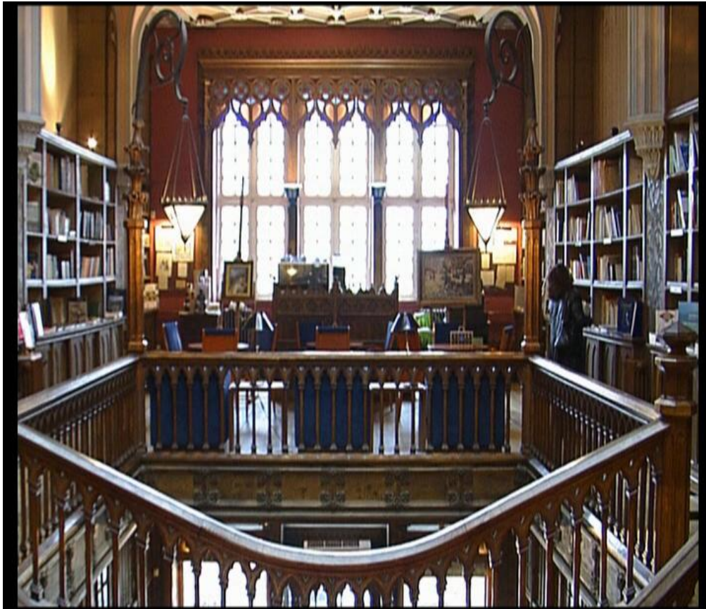
Fig.12 - Livraria Lello - “Um olhar sobre o Porto”, 2006

muitas das entidades contactadas para cedência dos espaços para filmagens, não se encontrarem disponíveis nas datas previstas e outras sim. Desta forma se houvesse descontrolo, iria encarecer bastante o valor do orçamento por causa dos custos aluguer do equipamento dia, foi portanto decidido adiar os prazos de captação das imagens de forma a que os dias fossem todos sequenciais arrumados em mais ou menos duas semanas.