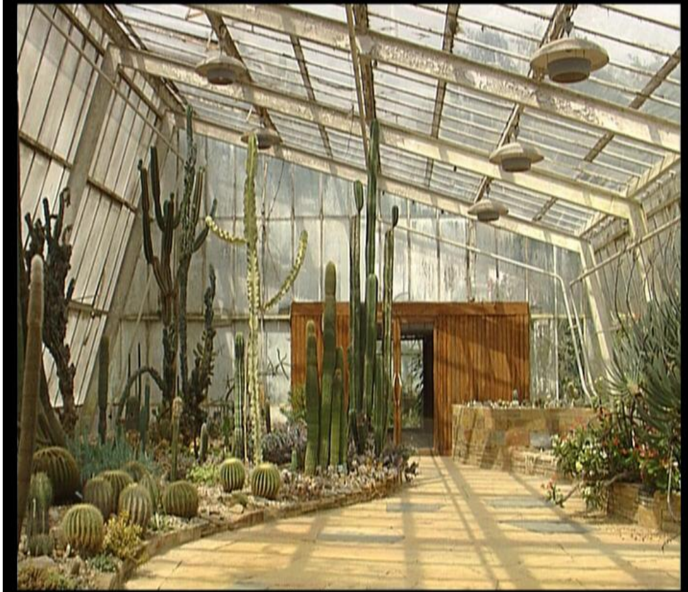
Fig.16 – Pormenor Jardim Botânico - “Um olhar sobre o Porto”, 2006