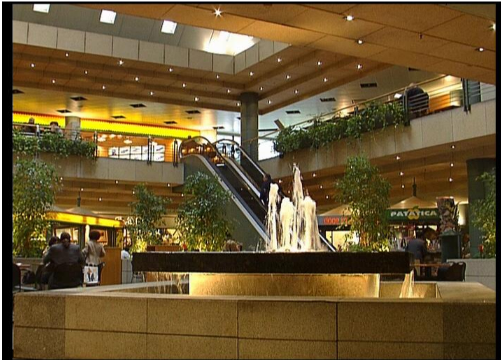
Fig.15 – Pormenor C.C. Península - “Um olhar sobre o Porto”,2006

Apesar de todas estas plataformas requerer formatos especiais, na sua essência a base das imagens foi conservada com a mesma base de dados, em um disco rígido, mantidas em pastas devidamente designadas por nomes, lugares e zonas, de forma a que se torne fácil a sua reutilização para futuros trabalho, sendo esta a base e a essência de todo este projecto do projecto Um olhar sobre o Porto .