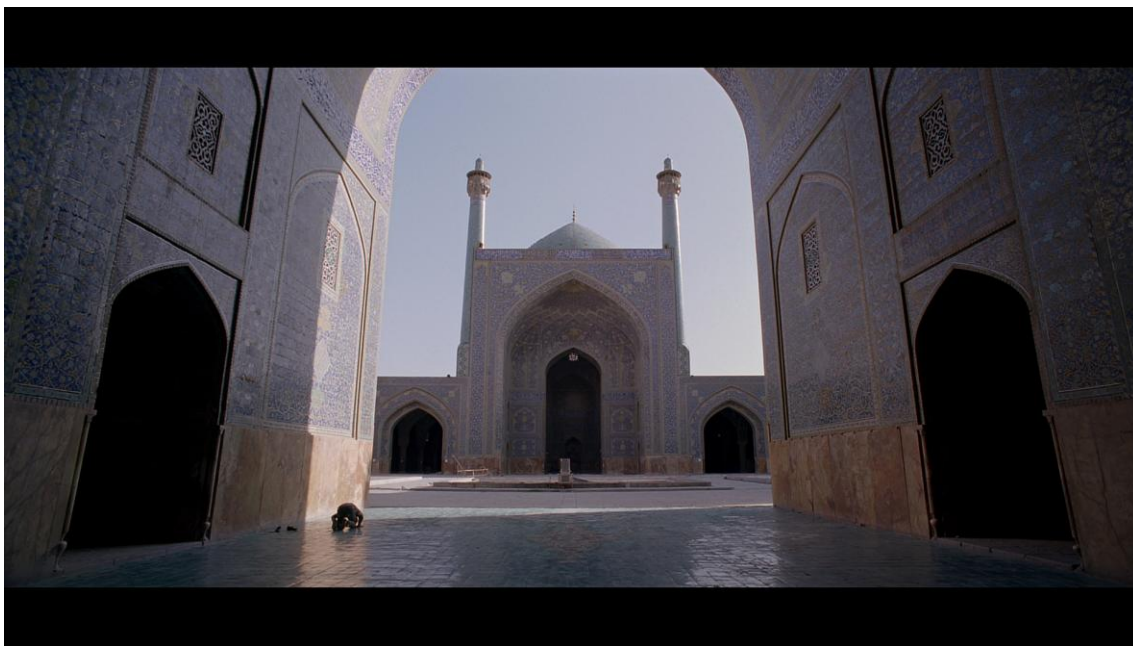
Fig.4 – “Baraka”, Ron Fricke , 1993

O filme começa com um grande eclipse solar e é estruturado como um poema épico, começando com um clima celestial, desce ao inferno, recapitula os seus temas de abertura e termina com uma estrela celeste. Uma sucessão de fotos de templos religiosos e locais sagrados intercalados com cenas de maravilhas naturais que gradualmente dão lugar a um retrato de miséria, frenesim urbano e horror ecológico antes que o filme recupere terreno elevado.