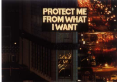
Fig.1 –“Messages to the Public”, Jenny Holzer,1986, pág.27