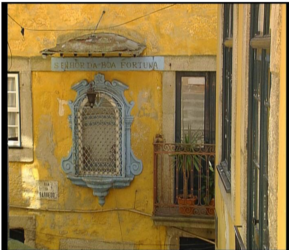
Fig.10 – Pormenor Ribeira do Porto - “Um olhar sobre o Porto”, 2006