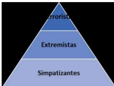
Figura 3: Pirâmide representativa do fenômeno, segundo a teoria de McCauley (2006)

Segundo Maikovich (2005), muitos dos novos recrutas apoiam a causa da organização e apreciam a sensação de identidade e propósito, assim percebida por fazerem parte do grupo, sendo que não querem, realmente, cometer atos violentos. No entanto, com o tempo, tornam-se mais radicais e procuram ter um papel mais interventivo – as organizações terroristas são extremamente hierárquicas, estando estruturadas de forma a que os mais novos não tenham de cometer atos de violência imediatamente, sujeitando-os, porém, a condições que favorecem a radicalização (Maikovich, 2005).