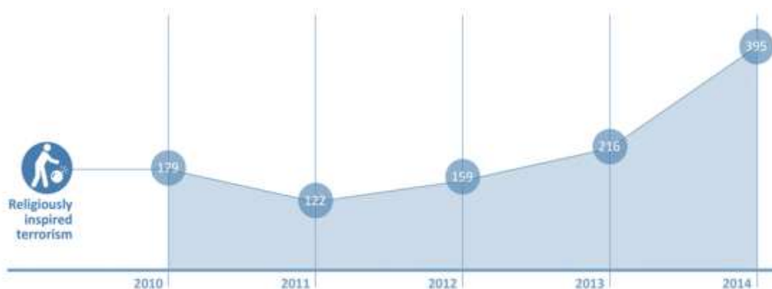
Figura 2: número de suspeitos presos por terrorismo religioso de 2010 a 2014 (Europol, 2015)

Os dados demonstrados, representam o número de ataques terroristas realizados (no mundo – Figura 1) e aqueles que são inspirados por motivações religiosas (na Europa – Figura 2); estes ilustram bem o impacto da problemática. É esta fatia significativa do fenómeno “terrorismo” (ligada especificamente ao fundamentalismo islâmico, no terrorismo religioso) que se pretende focar. Estes dados são considerados alarmantes, apoiando assim, a pertinência da constituição de programas de intervenção e prevenção.