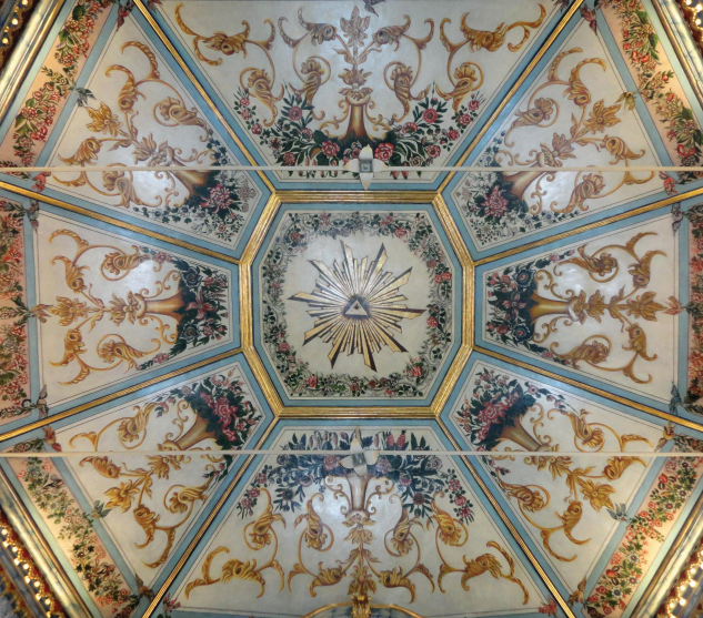
2 – Teto da capela do Senhor Santo Cristo