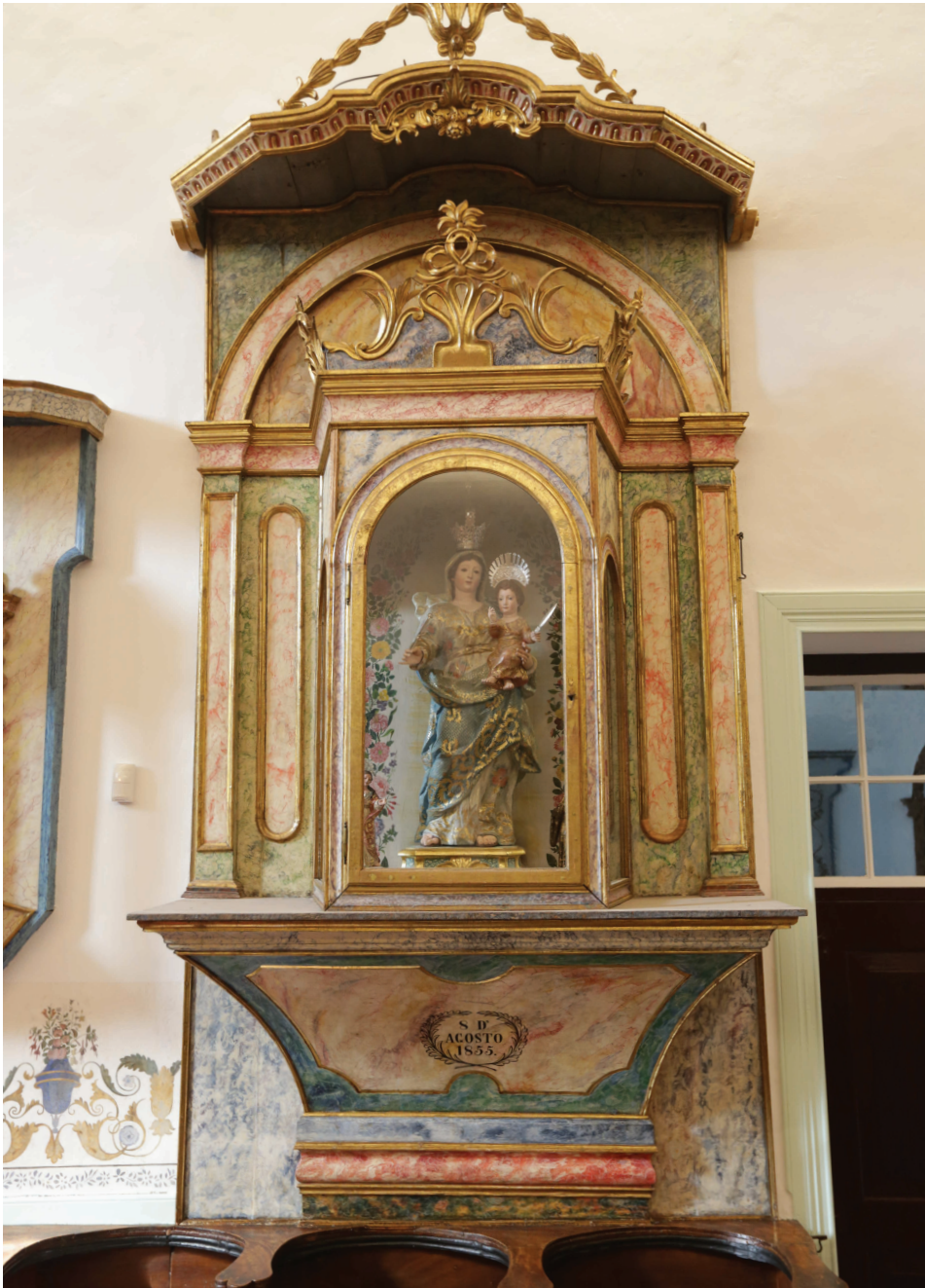
7 – Oratório de Nossa Senhora de Guadalupe