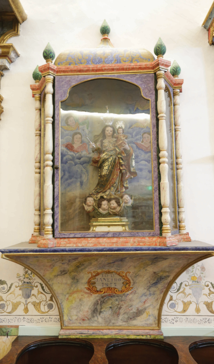
6 – Oratório de Nossa Senhora da Paz

lágrima invertida. A cúpula do oratório é decorada com elementos florais dourados sobre fundo azul e os emolduramentos possuem decoração marmoreada de fingimento. O interior do oratório possui pintura decorativa, onde um conjunto de querubins emerge de entre as nuvens. Assenta sobre uma base de forma triangular invertida, possuindo uma cartela central que insere a data de execução: 10 D'JANEIRO 1855 . A data inscrita na peanha parece corresponder à data da execução da última intervenção executada 51 . Os técnicos de conservação e restauro detetaram, sob a atual decoração, outras campanhas decorativas também com pintura de imitação de marmoreado, embora recorrendo a outras técnicas, materiais e tonalidades. No que respeita à decoração, aplicada nas tábuas de fundo deste oratório, a mesma poderá ser resultante de uma intervenção do século XX, como acontece no oratório anterior 52 .