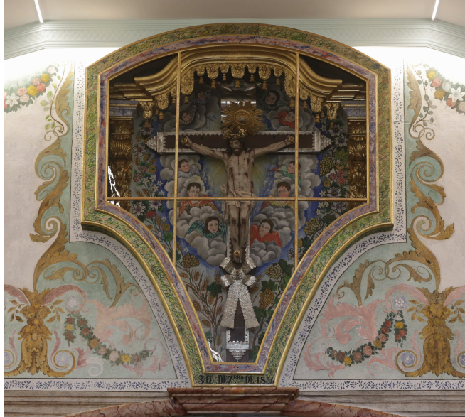
4 – Arco do coro alto 5 – Nicho de Cristo crucificado

Em conformidade com as informações prestadas pela empresa de conservação e restauro Nova Conservação SA , podem-se identificar, pelo menos, duas campanhas decorativas, nomeadamente ao nível do arco e porta e elementos entalhados no seu interior 50 . Na parte inferior, existe a inscrição da data 3 D' DEZ. bro DE 1854 , podendo ser relativa à segunda campanha decorativa, devendo a primeira ser anterior a esta data, talvez 2. a metade do século XVIII. A decoração aplicada às tábuas de fundo deste oratório poderá ter ocorrido já no século XX, apesar de não ter sido verificada nenhuma intervenção subjacente. É de salientar que a pintura interior apresenta características formais e técnicas em tudo idênticas à aplicada nas tábuas de fundo do oratório de N. Sr. a do Guadalupe.