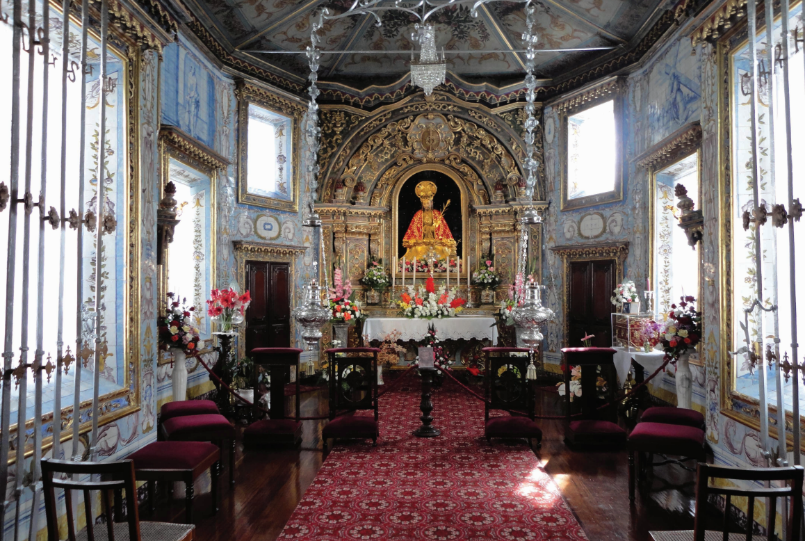
1 – Capela do Senhor Santo Cristo dos Milagres

Todos os quadros assentam em silbar e são separados por pilastras, de bases em mascarões, e volutas a susterem nichos com anjos e moldurados por conchas estilizadas que rematam, ao centro, em querubins e, lateralmente, com vasos floridos. (...) A cor única é o azul pouco vigoroso sobre branco, de melhor nuance nas figuras, e menos límpido nos molduramentos e mais acessórios. O desenho é desigual; correcto nas figuras dos painéis imprimindo-lhes movimentação, muito enfraquece, porém, nas restantes dos nichos dos plintos 41 .