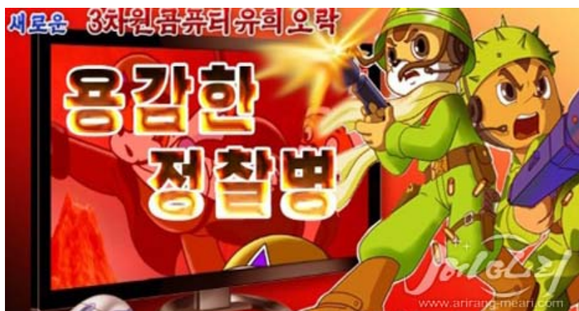
Figura 7 – Imagem promocional do jogo baseado em Esquilo e Ouriço “Batedores Corajosos” (yonggamhan cheongchalbyeong)