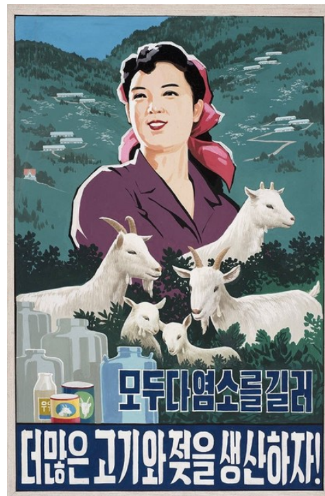
Figura 25 – “Vamos criar mais cabras... produzir mais carne e leite!” (data e autor desconhecidos)