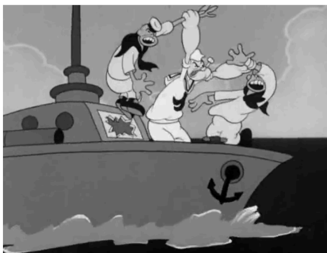
Figura 19 – Captura de uma cena de um episódio de Popeye You're a Sap Mr. Jap (Gordon, 1942 3:43)