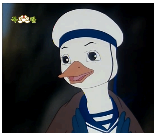
Figura 9 - Mulori sorrindo, episódio 14 (Kim, 1999: 1:49)

Tal como podemos constatar a partir das figuras apresentadas, os animais na série usam fardas militares. Estas variam consoante a sua espécie, sendo que os esquilos e os ouriços vestem um uniforme camuflado do exército, sendo que os últimos, usam ainda um capacete adaptado aos seus espinhos. Os patos, representados por Mulori na figura 9, por sua vez, usam um uniforme clássico da marinha. 29 No caso dos uniformes, é importante