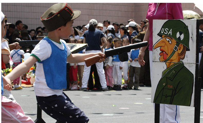
Figura 5 - Crianças participam num jogo onde têm de disparar sobre a imagem de um soldado americano

O terceiro método educativo descrito por Kim Il Sung relaciona-se com a participação activa das crianças e jovens em organizações infanto-juvenis criadas pelo estado, sendo isto característico dos regimes autoritários. Em vários países autoritários, houve uma necessidade de estabelecer organizações vocacionadas para a ocupação dos tempos livres das suas crianças e jovens e simultaneamente, inculcar ainda mais os valores oficiais.