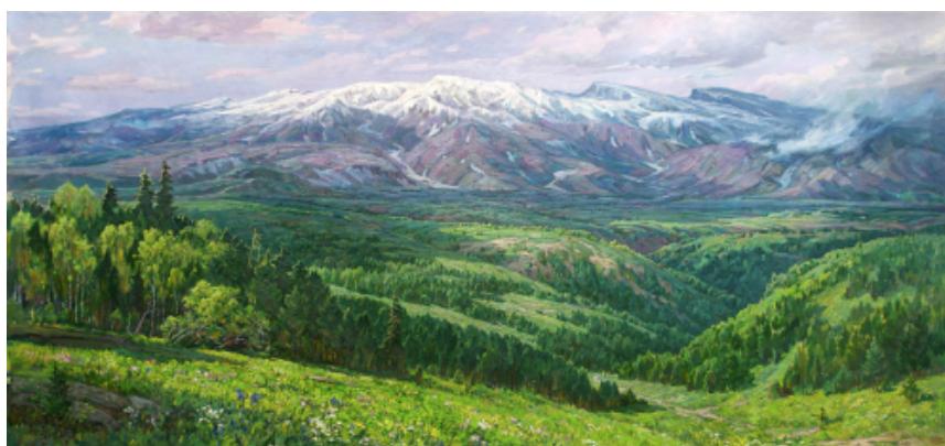
Figura 26 – Monte Baekdu em Junho por Kim Myong-un (2006)

Esta importância da ruralidade está presente também nos planos de fundo de Esquilo e Ouriço . Na figura 23 especificamente podemos ver um cenário que remonta para a pintura paisagística típica da Coreia do Norte. A representação das paisagens na arte norte-coreana não é uma simples reprodução da natureza, mas uma interpretação artística que dota a natureza com uma emoção estética que incentiva o sentimento de orgulho por parte do povo (Yoon, 2014). Esta natureza luxuriante é habitualmente pintada com cores vivas, de modo a mais eficazmente transmitir esta mensagem (Nielsen et al., 2015) (Figura 26). Por outro lado, esta beleza deve-se também ao facto de a Coreia do Norte se entender como uma nação abençoada pela presença dos grandes líderes (Phaidon, s/d), sendo ainda entendidas como símbolos do espírito virtuoso do povo coreano (Nasr, 2014). No entanto, é necessário ter em conta que, devido ao seu pendor alegórico, não existe qualquer menção a nenhum dos líderes norte-coreanos ao longo da série. Ao invés, podemos assumir que esta beleza natural se deve à união e harmonia dos habitantes do Monte das Flores, que devido ao seu amor e patriotismo cuidam da sua terra natal.