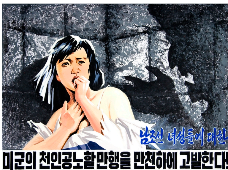
Figura 11 – “Denunciamos os crimes violentos contra as mulheres sul-coreanas cometidos pelos soldados americanos!” (Kim Hang-nim, 2000)