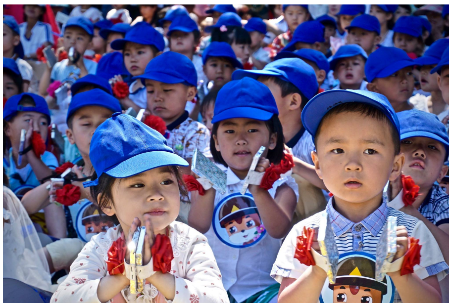
Imagem 2 – Crianças norte-coreanas usando crachás de Geumsaeg nas celebrações do Dia da Criança (Ramblin' Randy, 2016)

Fonte: https://www.latimes.com/world/asia/la-fg-north-korea-nursery-school-20160504-snap-htmlstory.html (acedido pela última vez a: 28/10/2020)