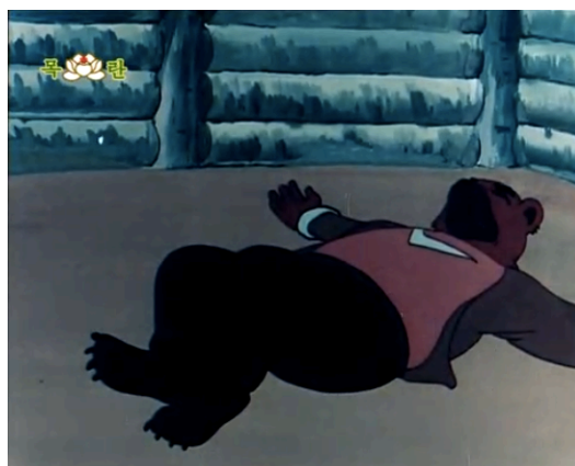
Figura 18 - O Tio Urso inconsciente, episódio 1 (Kim, 1977a: 13:19)

Uma outra personagem que tende a ter uma interpretação metafórica é o Tio Urso ( gomajeossi ). Este urso aparece apenas no primeiro episódio, e devido à sua força, é o protector dos animais do Monte das Flores, mas tem o grande defeito de regularmente se embriagar. Sabendo desta informação, o Comandante Fuinha envia-lhe uma garrafa de vinho envenenado. Ao bebê-la, o urso fica incapacitado, como podemos ver na Figura 18. Com o seu defensor neutralizado, as fuinhas conseguem finalmente atacar o Monte das Flores, deixando os seus habitantes sozinhos para defender o seu território, e dando assim início à guerra. Para muitos, devido ao facto do urso ser um símbolo da identidade cultural russa, esta cena da série é uma clara provocação à União Soviética, em relação à qual a Coreia do Norte se tinha já afastado na altura da estreia deste episódio. Contudo, por não termos dados que permitam confirmar esta representação, podemos apenas assumir que a decadência do Tio Urso e a conseqüente união dos restantes animais na luta pela sobrevivência da sua pátria, simboliza o isolamento da Coreia do Norte em relação ao mundo exterior e o seu espírito de auto-subsistência.