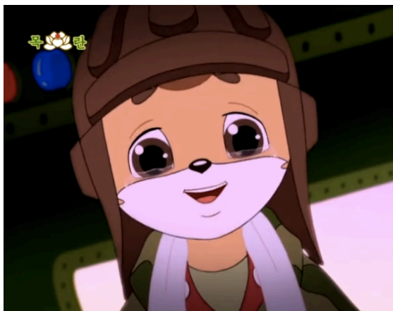
Figura 15 - Geumsaeg comove-se ao chegar ao Monte das Flores, episódio 27 (Oh, 2006: 1:49)