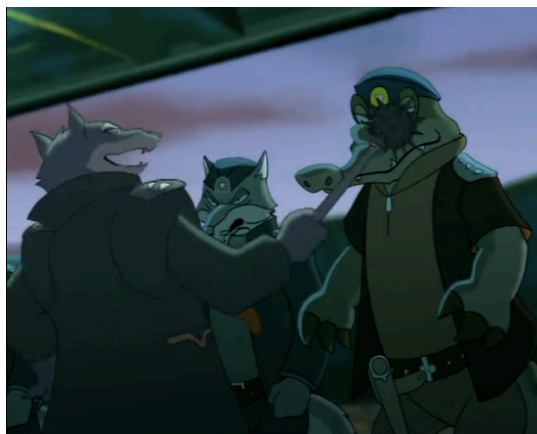
Figura 28 - Interior da nave do Comandante Chacal, episódio 27 (Oh, 2006: 1:05)