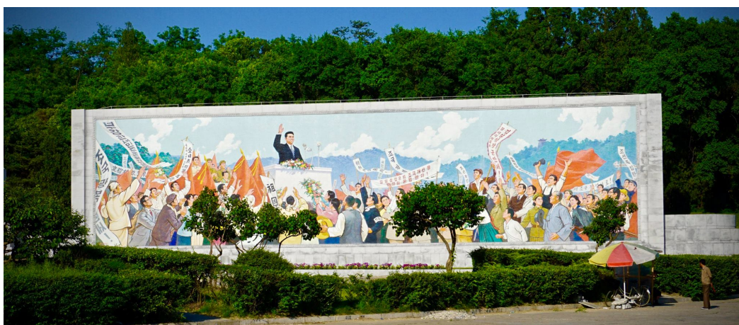
Figura 3 – Fotografia de um mural de mosaico em Pyongyang (Ramblin’ Randy, 2016)

Apesar de ter sido apenas na década de 1990, com Kim Jong Il, que foi escrito um primeiro tratado artístico na Coreia do Norte, Kim Il Sung tinha também elaborado uma teoria artística durante o seu governo. Numa série de discursos, Kim Il Sung apelidou os artistas de “engenheiros da alma humana”, comparando-os a soldados combatentes mas numa frente cultural, cujos objectivos eram desenvolver uma cultura nacional, promover ideias patrióticas e cultivar convicções vitoriosas (David-West, 2009). Por sua vez, foi com Kim Jong Il que houve um afastamento do termo “realismo socialista” e a adopção do realismo Juche ou arte Juche . No seu tratado sobre arte On Fine Art (misullon) Kim Jong Il define esta arte como sendo nacional na sua forma e socialista no seu conteúdo. Por essa razão, é indispensável a inclusão do espírito partidário, o espírito da classe trabalhadora e o conteúdo popular na produção artística, de modo a ser melhor apreciada pelo povo 16 (Kim, 1991).