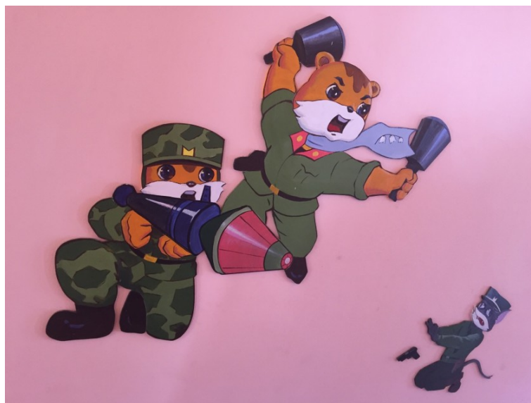
Imagem 1 – Decorações de Geumsaeg e Juldaram a atacar Mulmangcho no infantário da quinta Changchon (Makinen, 2016)