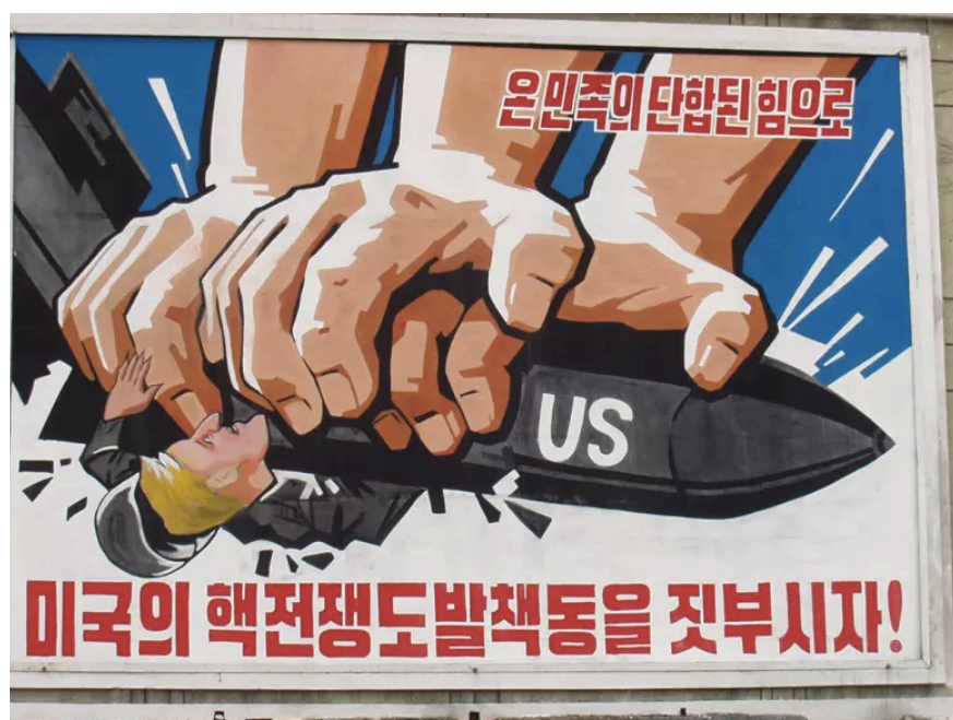
Figura 1 – Fotografia de um poster encontrado nas ruas de Pyongyang, “Vamos esmagar o esquema de guerra nuclear americano com todo o poder da nossa nação unificada!” (data e autor desconhecidos)

A propaganda é, pois, um acto de controlo exercido por parte das entidades que a criam. Na Coreia do Norte, este controlo é feito também através da informação que chega, ou não, à população norte-coreana. Os principais, e únicos, veículos de informação norte-coreanos seguem à risca a ideologia oficial do regime, 9 disseminando-a e inculcando-a nos seus cidadãos, de todas as idades. É algo que permeia todo o dia-a-dia dos norte-coreanos, desde posters como o da Figura 1 que decoram as ruas das suas cidades, até a sua educação e meios de entretenimento.