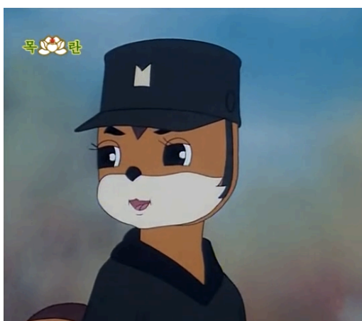
Figura 8 - Juldaram sorrindo, episódio 14 (Kim, 1999: 2:09)

período sem se verem, o esquilo Juldaram e a pata Mulori se reencontram no território dos inimigos. Quer nos episódios iniciais como nos mais recentes, os habitantes do Monte das Flores normalmente surgem a sorrir, com os olhos brilhantes e, apesar das suas idades não serem explícitas, têm uma aparência infantil. Podemos relacionar esta escolha estética com a ideia de “raça infantil” apresentada por B.R. Myers (2010), segundo a qual os norte-coreanos por serem intrinsecamente inocentes e espontâneos, são como crianças e necessitam de um líder que funcione como uma figura parental para garantir a sua sobrevivência. Embora nenhum dos líderes esteja presente em Esquilo e Ouriço , a escolha das espécies assim como o modo como são desenhadas vêm ao encontro desta ideia de infantilização. Por outro lado, as suas aparências mais amigáveis e adoráveis têm o propósito de levar os espectadores a identificarem-se com estas personagens e, conseqüentemente, a torcerem por elas.