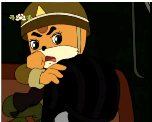
Figura 21 - Geumsaeg asfixia um rato, episódio 26 (Yun, 2005: 12:36)