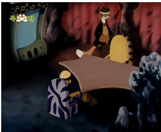
Figura 27 - Escritório do Comandante Fuinha, episódio 9 (Kim, 1998: 1:42)