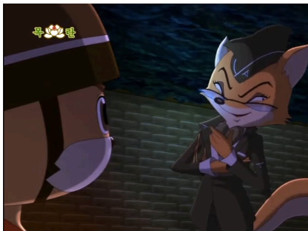
Figura 14 - A Tenente Raposa conversa com Geumsaeg, episódio 32 (Lee, 2012: 2:06)

Um outro aspecto que diferencia os dois lados do conflito, é modo ambos expressam as suas emoções. Ao longo da série, os protagonistas expressam uma maior variedade de estados emotivos do que os antagonistas, embora sejam mais reprimidos quando estão a trabalhar. Os habitantes do Monte das Flores sorriem, irritam-se, comovem-se e choram, demonstrando uma forte ligação aos seus compatriotas e à sua terra-natal. A figura 15 é um fotograma do episódio 27 no momento em que Geumsaeg regressa ao Monte das Flores, vendo os outros animais a celebrarem a sua chegada e a dos demais. Os seus olhos enchem-se de lágrimas, demonstrando a sua profunda alegria por voltar a casa. Quando os batedores se encontram durante as suas missões, e caso estejam escondidos, abraçam-se calorosamente e os seus olhos brilham, manifestando as saudades que têm dos seus compatriotas. Por outro lado, enquanto cumprem as suas missões, ou quando passam por um momento de maior dificuldade, as suas expressões tornam-se sérias e concentradas, sem nunca perderem, contudo, o brilho dos olhos característico dos animais do Monte das Flores. Na figura 16 podemos ver o ouriço Goseumdochi quando está prestes a despenhar-se contra a arma do exército do Comandante Fuinha. As sobrancelhas franzidas e os lábios premidos, enquanto o suor lhe escorre pela cara, evidenciam a sua determinação.