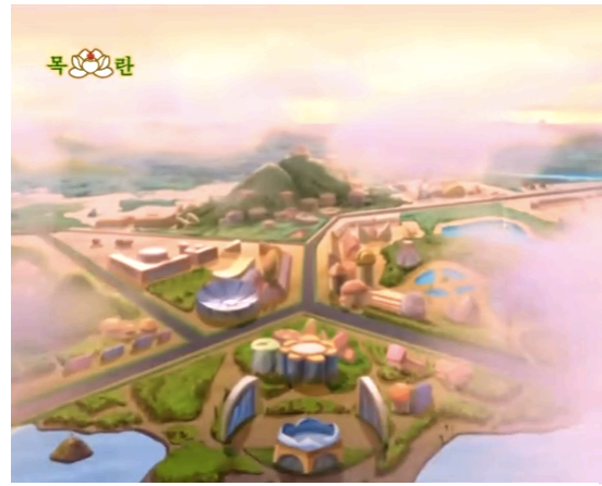
Figura 24 - Vista aérea do Monte das Flores, episódio 27 (Oh, 2006: 1:46)