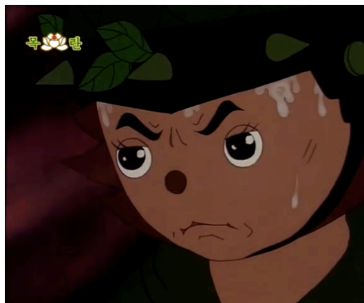
Figura 16 - Goseumdochi concentrado enquanto pilota um avião, episódio 9 (Kim, 1998: 17:10)

Por outro lado, os inimigos têm um conjunto mais restrito de emoções. Apesar de alguns serem igualmente determinados, caracterizam-se pela sua violência, brutalidade e crueldade, assim como pela falta de inteligência e cobardia em alguns casos. No caso de personagens mais competentes e sérios como o Comandante Fuinha, Mulmangcho e o Comandante Chacal, estes mantêm as sobrancelhas franzidas mesmo quando estão a sorrir. Quando estão a pensar em planos para destruir o Monte das Flores, são feitas grandes aproximações aos seus rostos, e no caso do Comandante Chacal os seus olhos brilham (Figura 17). O objectivo desta aproximação é realçar as características monstruosas das suas feições e, deste modo, incentivar sentimentos negativos por parte dos espectadores em relação a estas personagens. Mas personagens de comic relief , como Oegwipari, por exemplo, devido à sua cobardia e ignorância, riem-se e choram, aludindo à sua fraqueza de espírito.