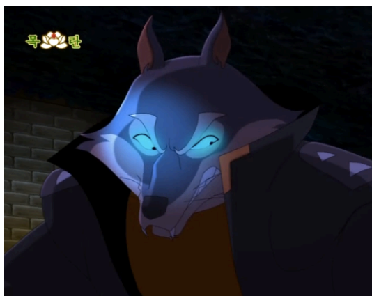
Figura 17 - O Comandante Chacal, episódio 32 (Lee, 2012: 1:23)

ter em conta que não existe nenhuma informação explícita na série nem declarações por parte do SEK que confirmem estas deduções. Por esta razão, podemos considerar que na verdade os invasores do Monte das Flores, de um modo geral, representam apenas o modo como a Coreia do Norte entende os seus inimigos dentro do binário “nós” e “os outros”.