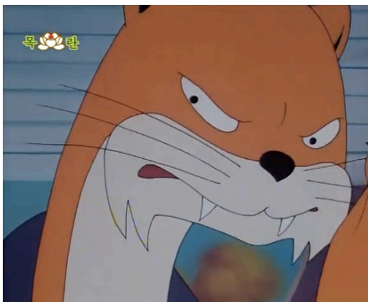
Figura 12 - Comandante Fuinha, episódio 14 (Kim, 1999: 3:06)