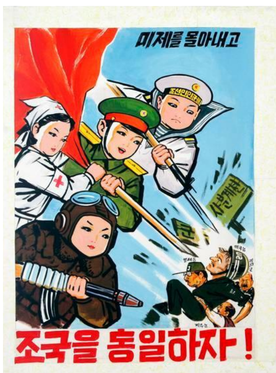
Figura 2 - Poster encontrado num infantário em Pyongyang, “Vamos afastar os americanos e unificar a nossa mãe-pátria” (data e autor desconhecidos)

É importante ter em conta o papel da criança enquanto elemento activo quando analisamos Esquilo e Ouriço . Os protagonistas, sendo na sua maioria representados por animais adoráveis, têm uma aparência infantil, apesar das suas idades não serem explícitas. E estas personagens não são apenas vítimas, uma vez que participam activamente em actos de violência. A propaganda que politiza a figura da criança é assim um elemento importante nos mecanismos de manutenção do regime autoritário da Coreia do Norte.