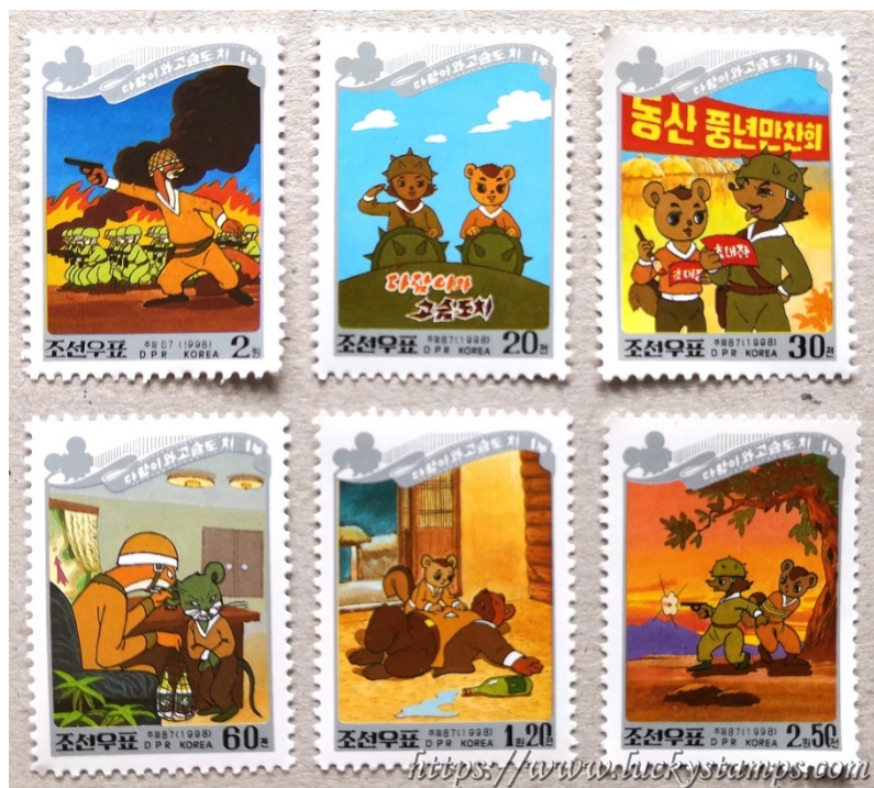
Imagem 3 – Selos de Esquilo e Ouriço