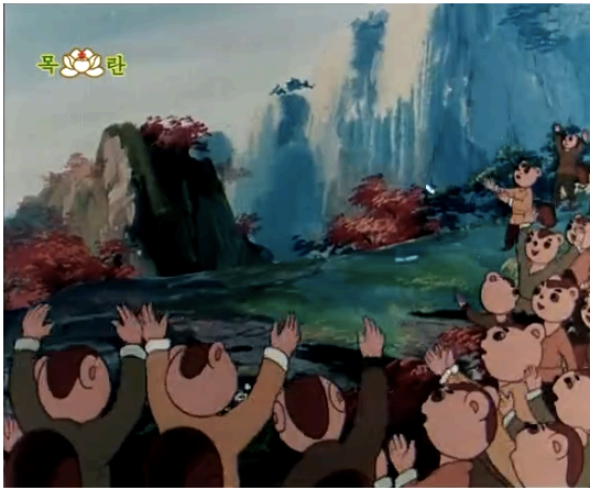
Figura 23 - Os esquilos celebram a colheita bem sucedida, episódio 1 (Kim, 1977: 3:57)

é representada não só pelo tema em si (neste caso a criação de cabras) mas também pela paisagem rica e verdejante que rodeia as figuras centrais.