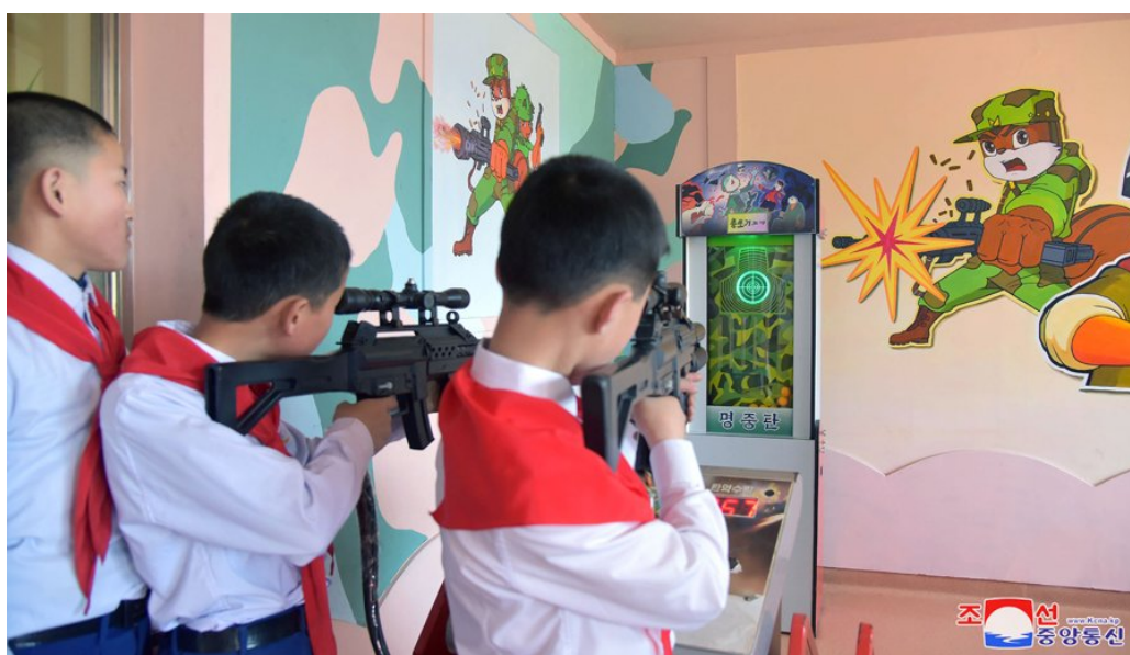
Figura 6 - Crianças de Pyongyang a jogar na arcada do Campo Infantil Mangyongdae com decorações de Esquilo e Ouriço (data e autor desconhecidos)