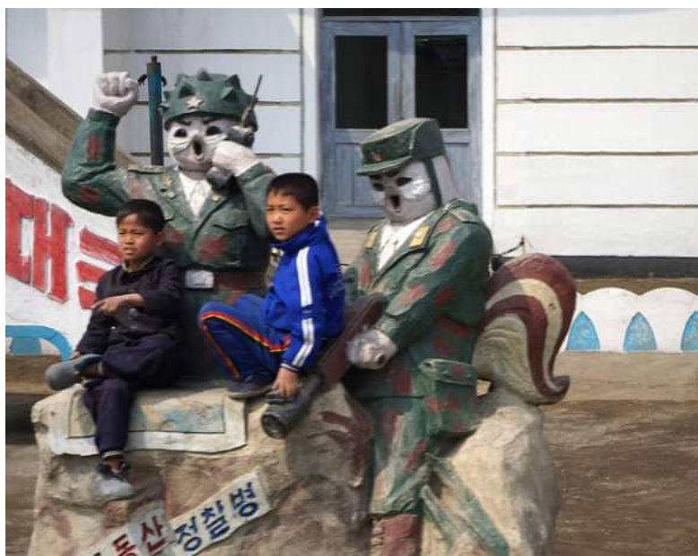
Imagem 6 – Escultura de Esquilo e Ouriço num parque infantil norte-coreano

http://www.uriminzokkiri.com/index.php?ptype=cfopho&stype=0&ctype=0&page=1&language=eng&mtype=view&no=9483 (acedido pela última vez a 14/11/2020)