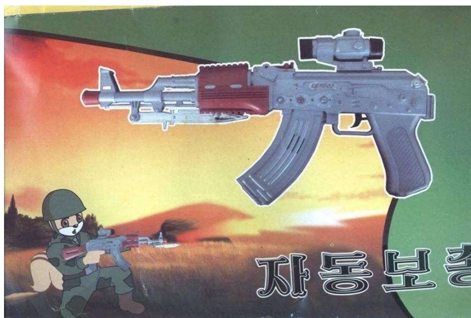
Imagem 4 – Arma de brincar de Esquilo e Ouriço

Fonte: https://www.luckystamps.com/north-korea-stamp-1998-korean-cartoon-film-squirrels-and-hedgehogs-sheetlet-mnh-no-3868-3873-.html (acedido pela última vez a 14/11/2020)