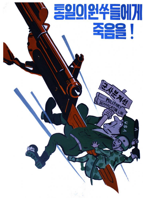
Figura 20 – “Matem os inimigos que ameaçam a nossa pátria-mãe!” (data e autor desconhecidos)