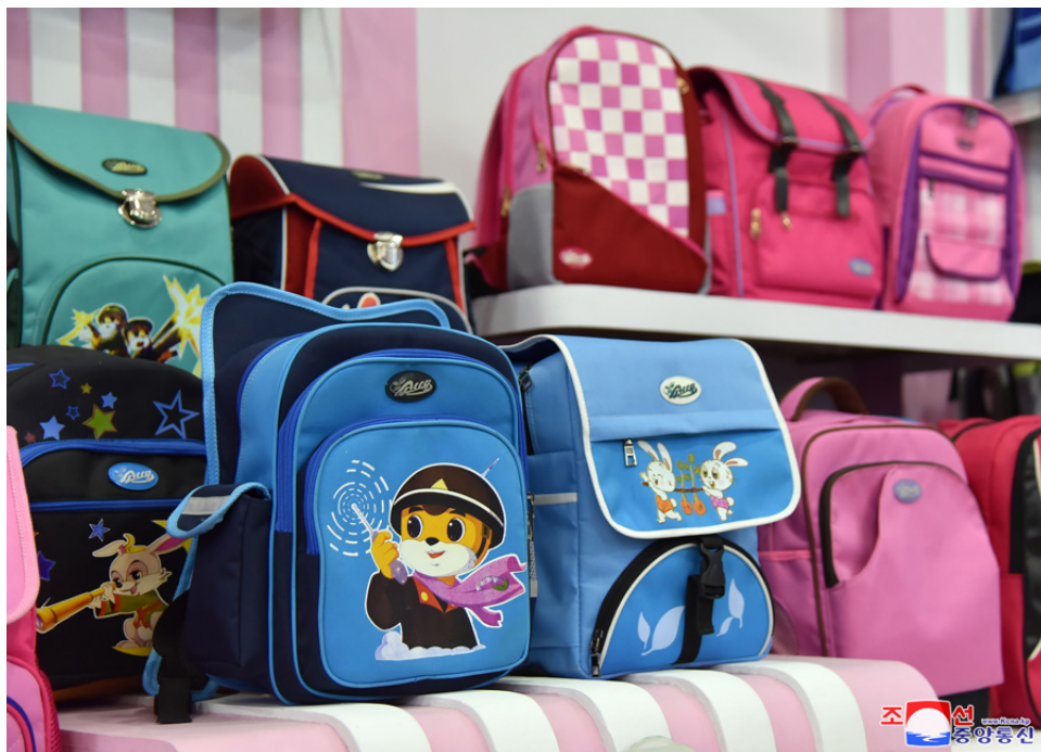
Imagem 5 – Mochilas de Esquilo e Ouriço na fábrica de malas de Pyongyang