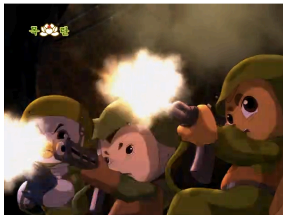
Figura 22 - Três jovens batedores do Monte das Flores disparam contra inimigos, episódio 32 (Lee, 2012: 20:45)

Um outro aspecto que devemos ter em conta quanto à visualidade de Esquilo e Ouriço diz respeito aos ambientes e aos planos de fundo. Dependendo do local onde a acção ocorre, quer seja no território inimigo ou no Monte das Flores, as cores, a luz e a atmosfera que rodeiam os personagens muda. Existem também espaços neutros, nomeadamente a floresta que envolve ambos os territórios, mas habitualmente ao longo da série espaços luminosos e coloridos estão associados ao Monte das Flores e aos seus habitantes, enquanto que espaços escuros e monocromáticos caracterizam o território dos antagonistas.