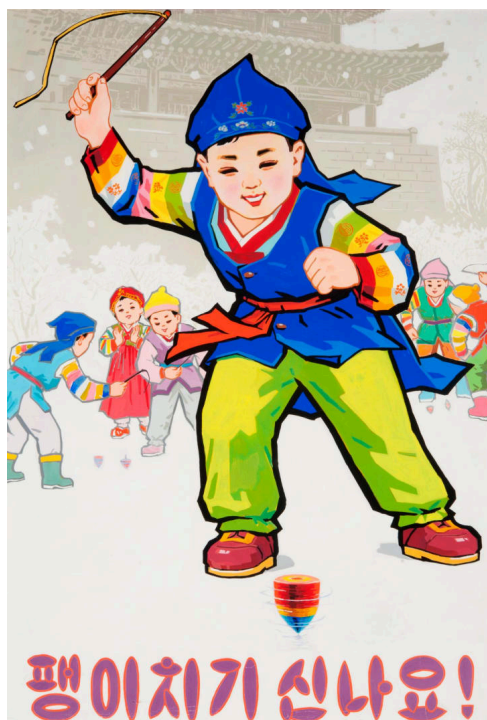
Figura 4 – “Peões são divertidos!” (data e autor desconhecidos)

crianças têm nestes regimes e a carga simbólica que elas carregam. Em contextos como a Coreia do Norte, as crianças são consideradas o futuro da revolução, os futuros membros da classe trabalhadora que garantem a continuidade do regime e do sistema a que pertencem. Torna-se assim fulcral que elementos ideológicos, como o nacionalismo e o militarismo, sejam adaptados de modo a facilitar a sua apreensão pelas crianças.